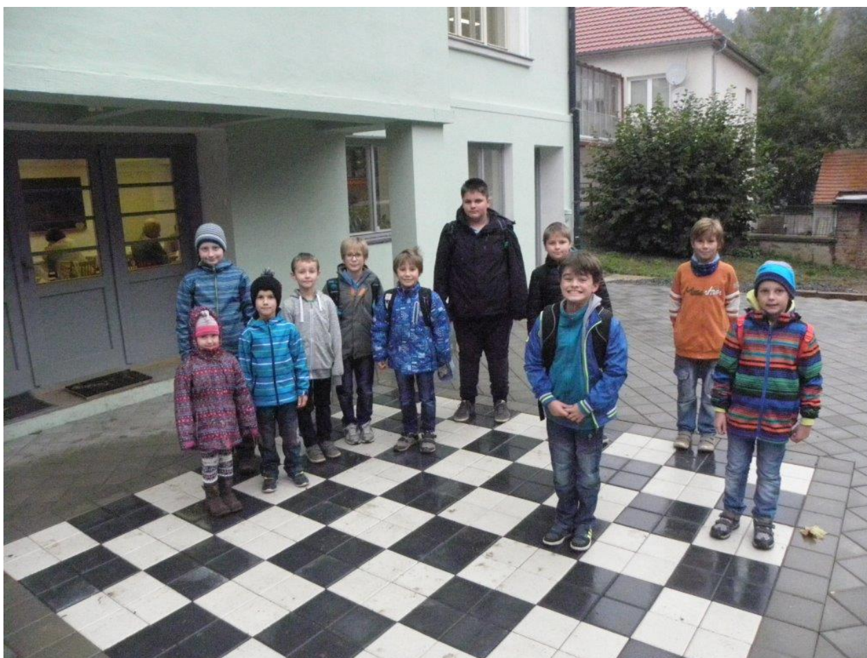
379 kroužek DDM – venkovní šachovnice