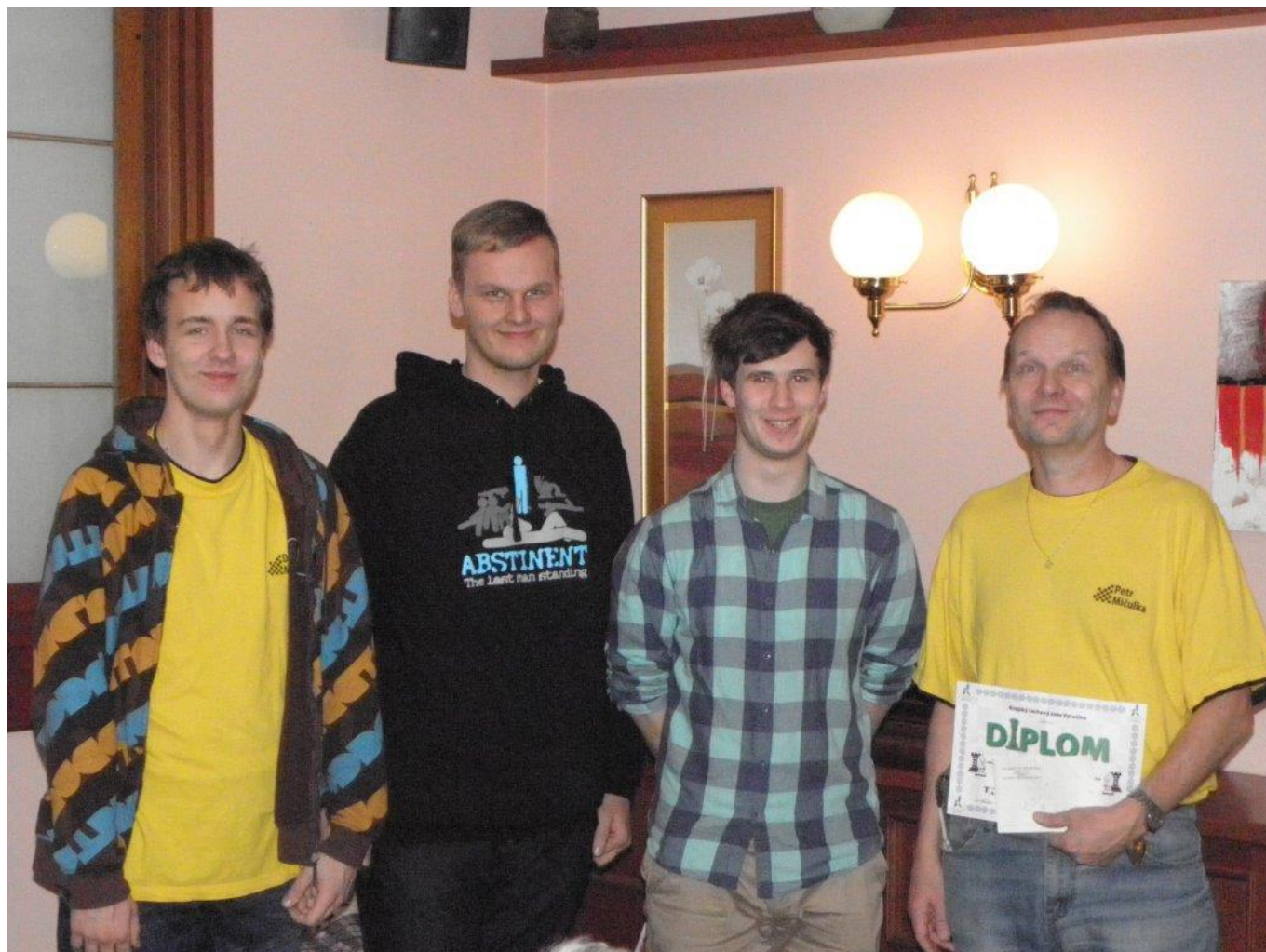
389 družstvo Náměště druhé na KP v bleskovém šachu

Absolutní pořadí: 1. Vala 15,5, 2. Karásek 14,5, 3. Vít Kratochvíl 13,5 ...10. David Mičulka a 11. Petr Walek po 9,5, 19. Tomáš Košut a 23. Petr Mičulka po 9 ... Zajímavý byl vyrovnaný střed celkového pořadí – hned 28 hráčů na 14.-41. místě bylo v rozmezí pouhého 1 bodu!