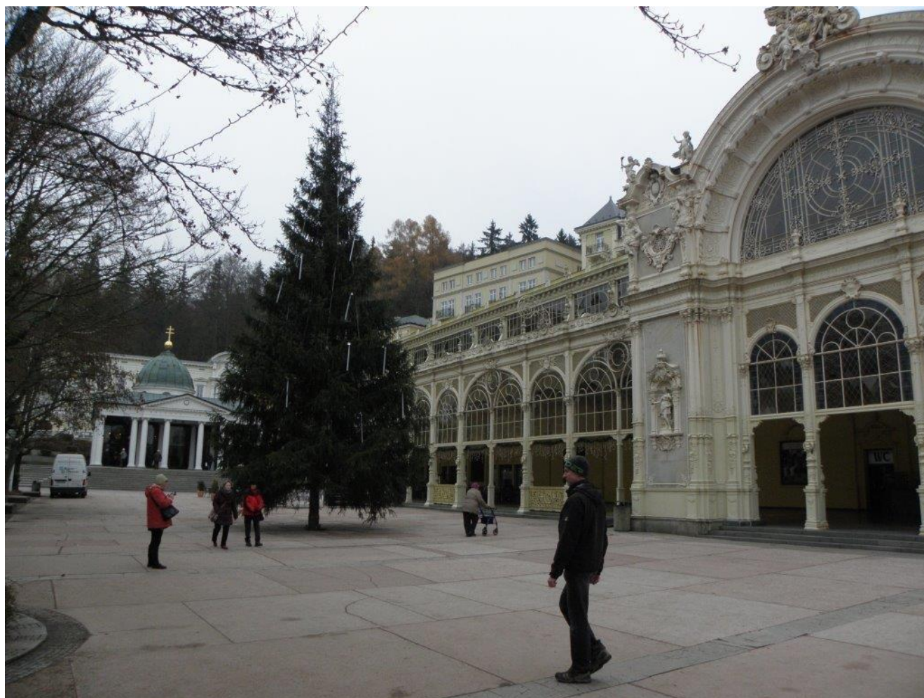
384 kolonáda v Mariánských Lázních