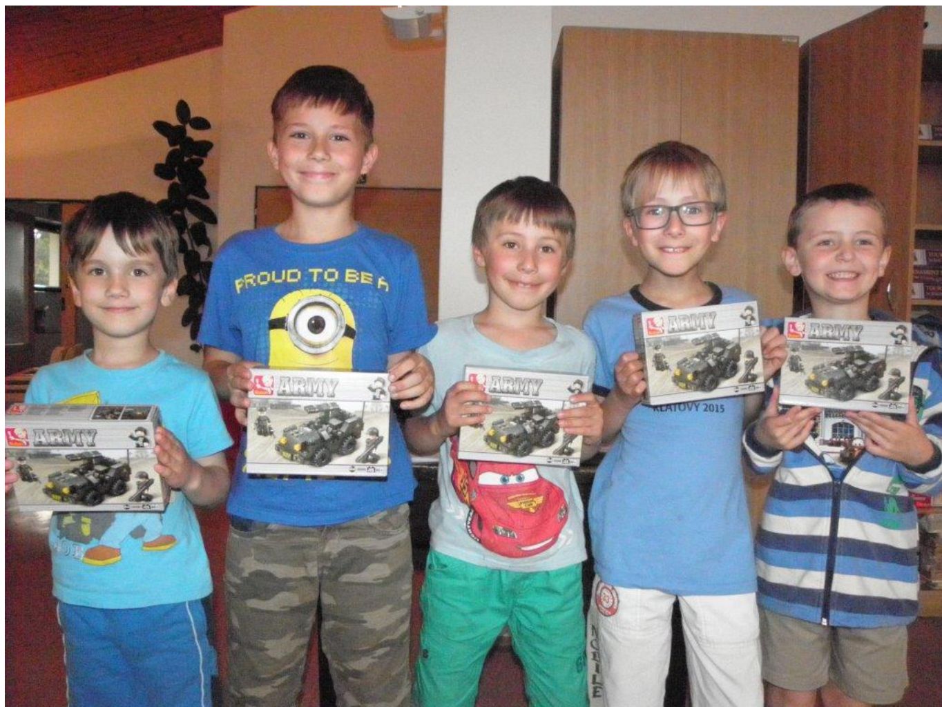
372 přebor žáků do 15 let š.o. TJ Náměšť nad Oslavou