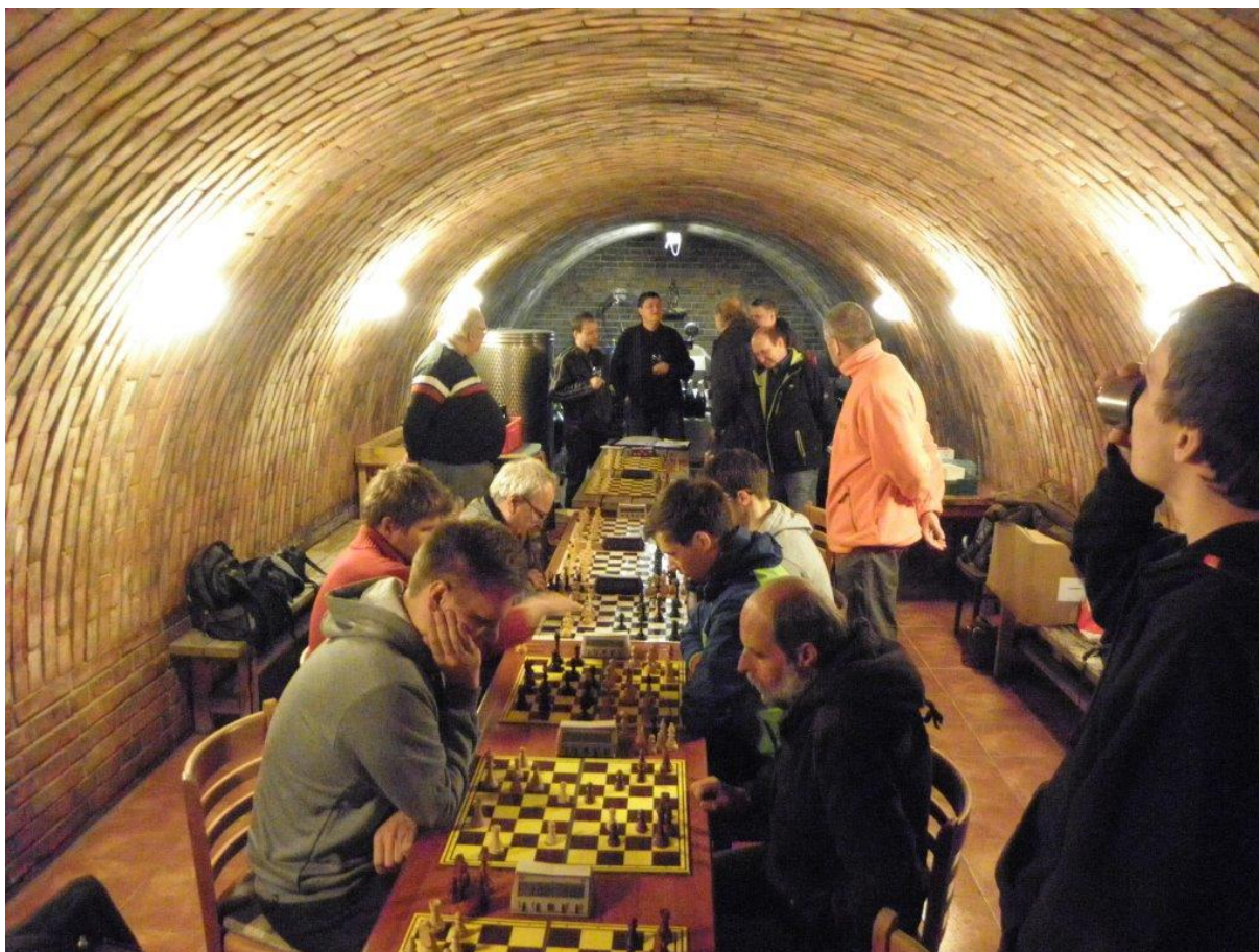
368 bleskový zápas na Sádce