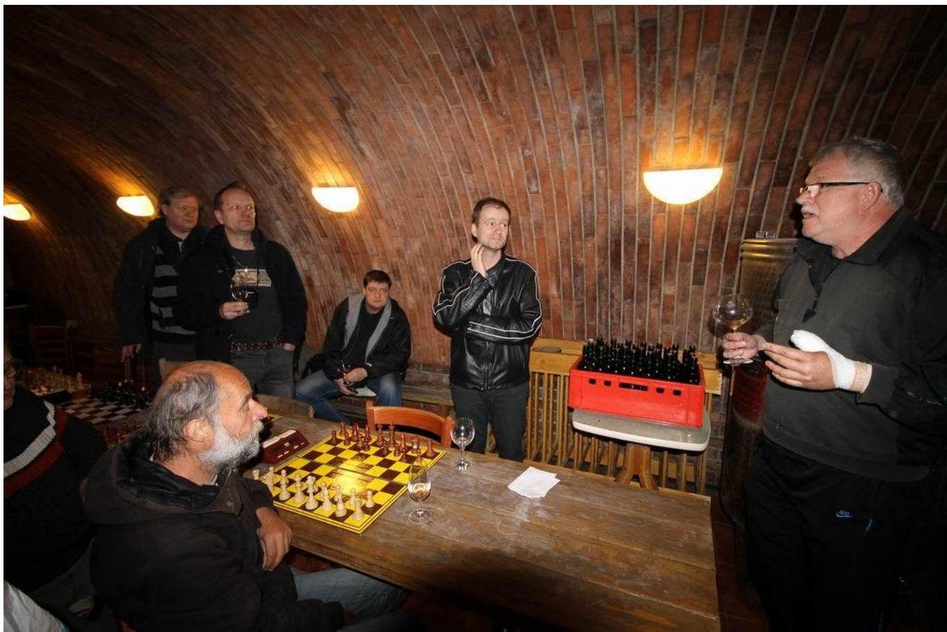
368 zajímavé povídání pana Lampíře o víně