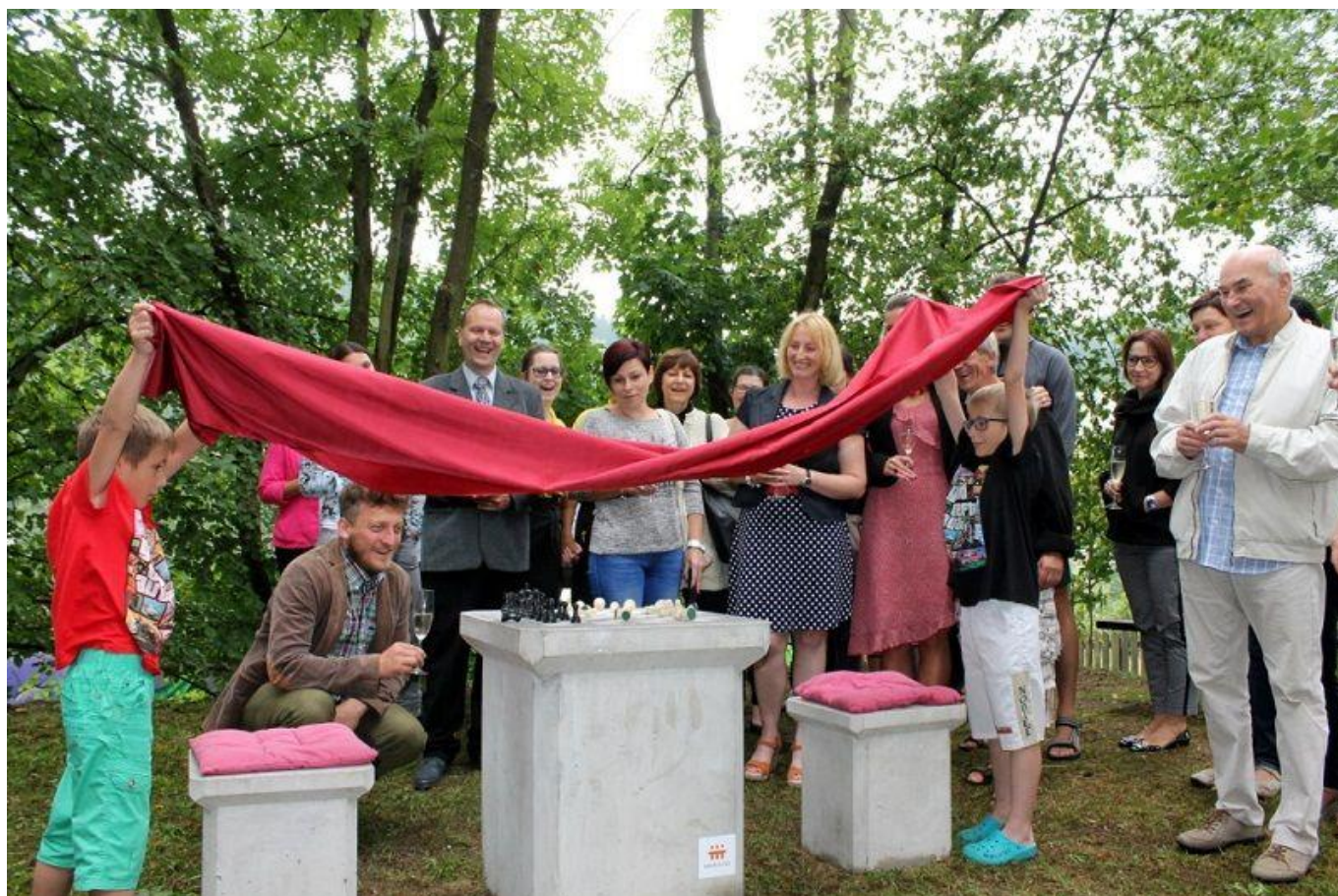
375 šachy v parku

Našel jsem další článek s jinými fotkami: http://www.regionvysocina.cz/zpravodajstvi/sachove-partie-na-cerstvem-vzduchu-v-namesti-130348/