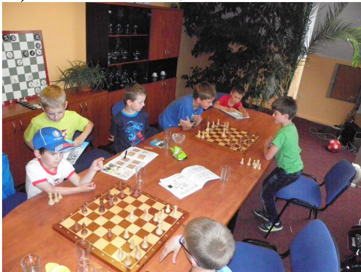
374 první letní trénink mládeže