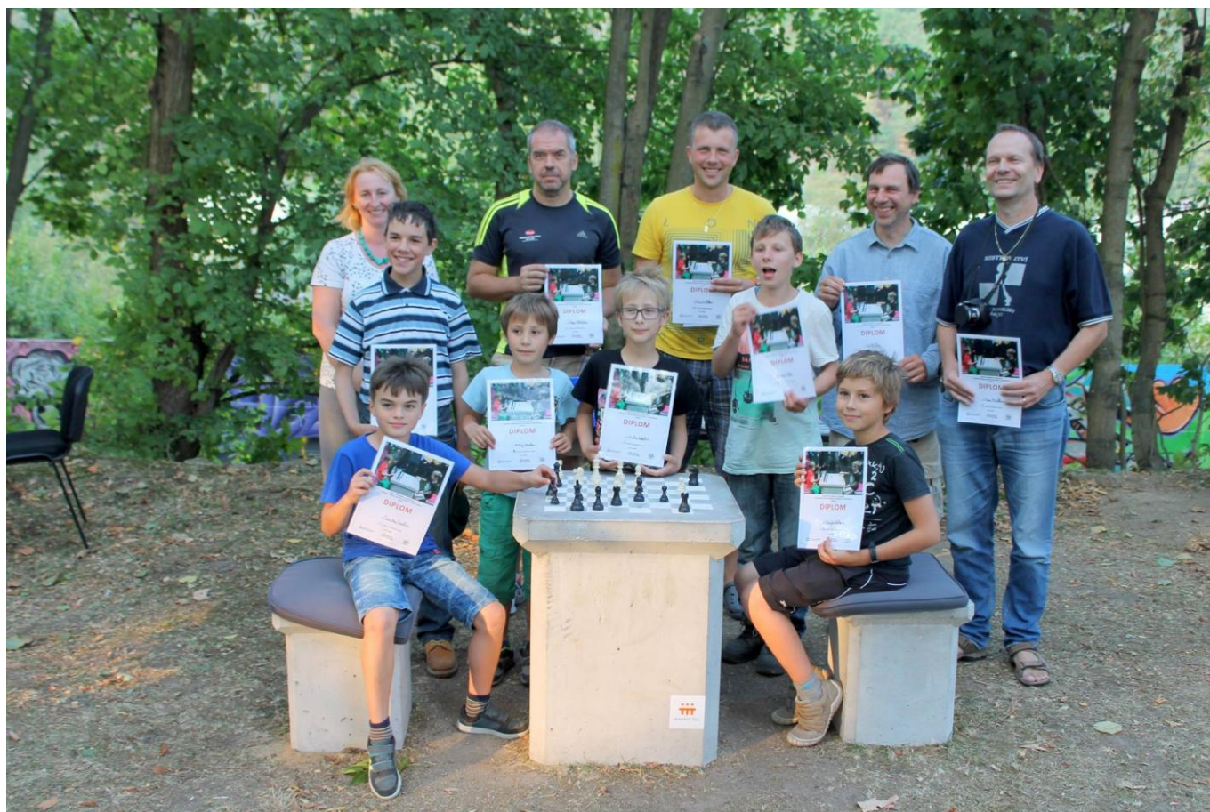
377 turnaj v parku