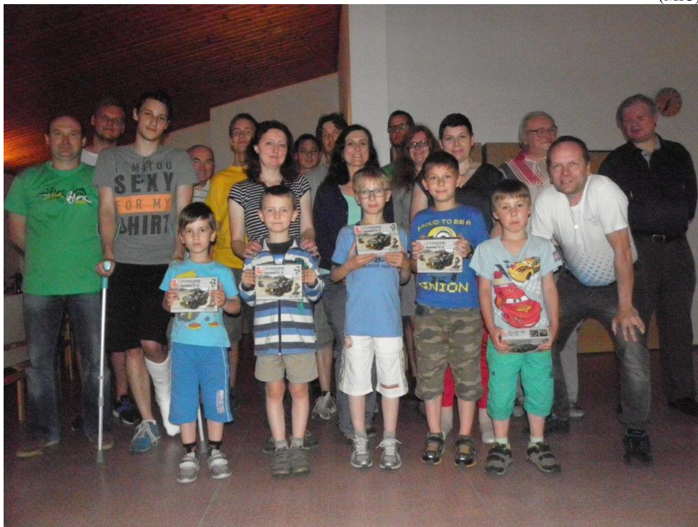
372 společné foto rozlučka 2016