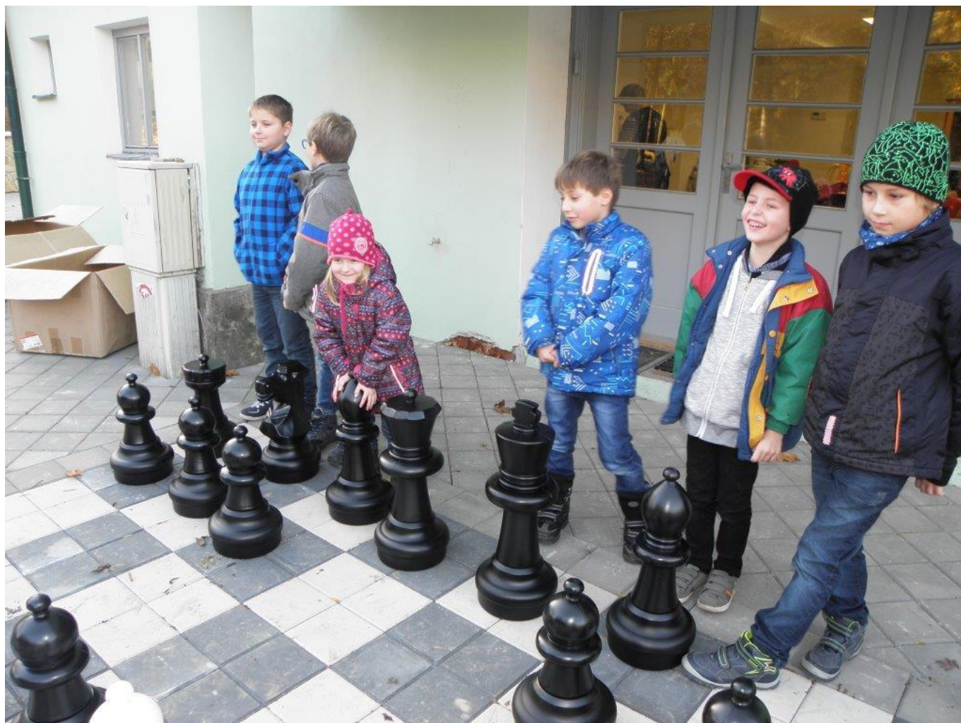
381 venkovní šachy