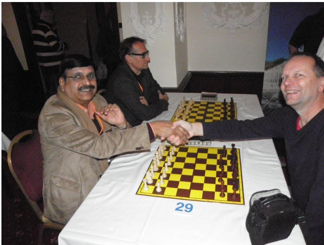
384 soubor Indie - ČR