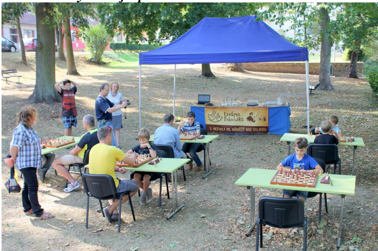
377 turnaj v parku