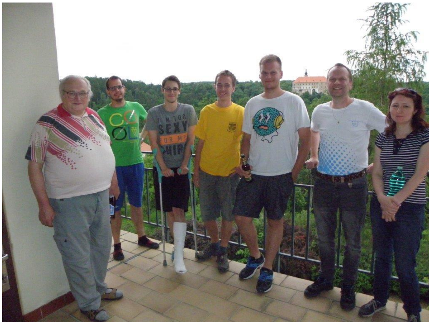
372 účastníci bleskového přeboru oddílu