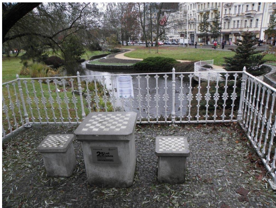
384 šachy v parku před hotelem Polonia, ve kterém jsme bydleli