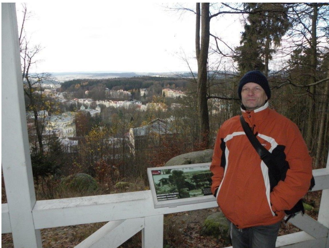
384 na jedné z procházek kolem Mariánských Lázní