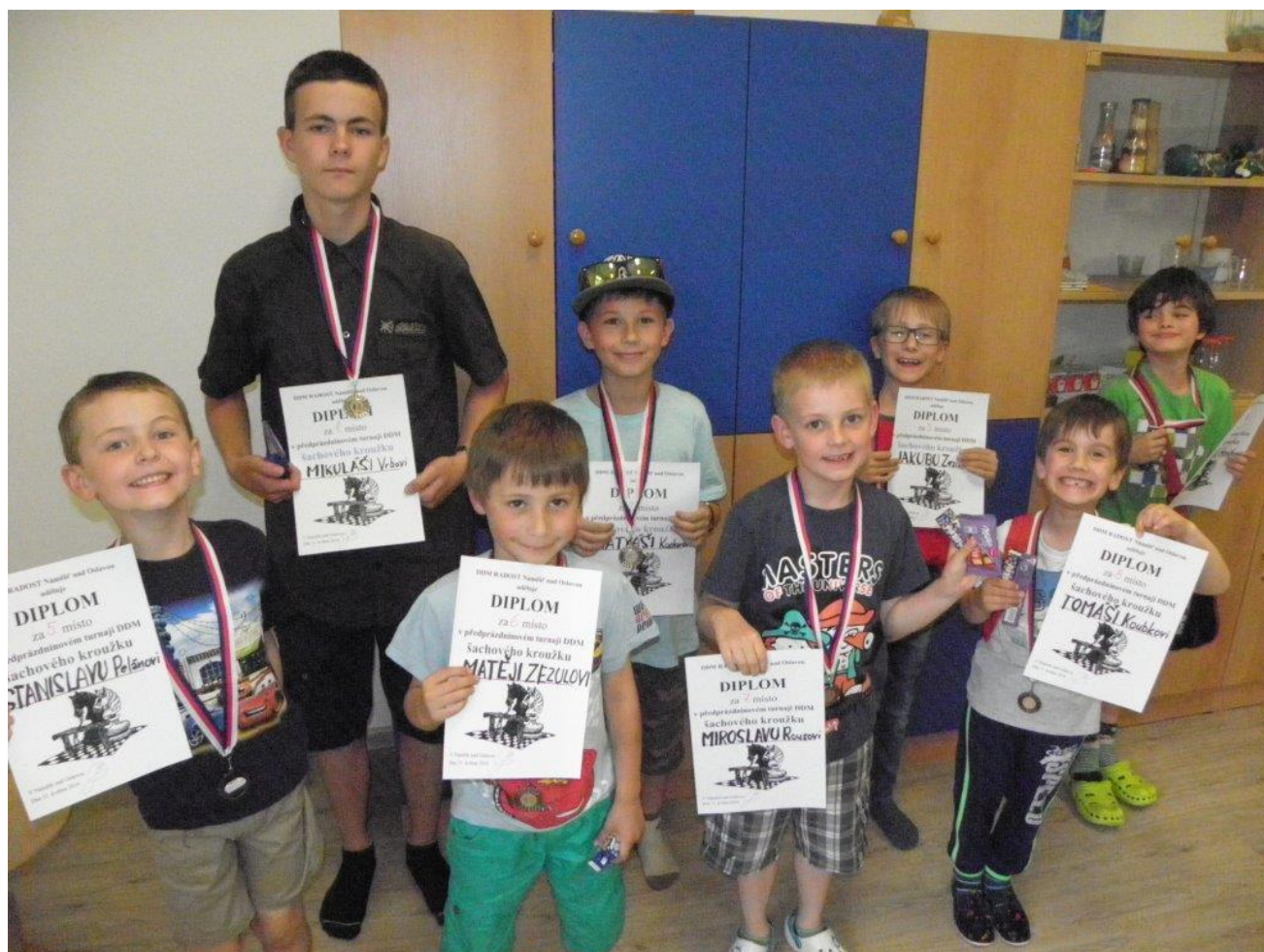
371 předprázdninový turnaj DDM