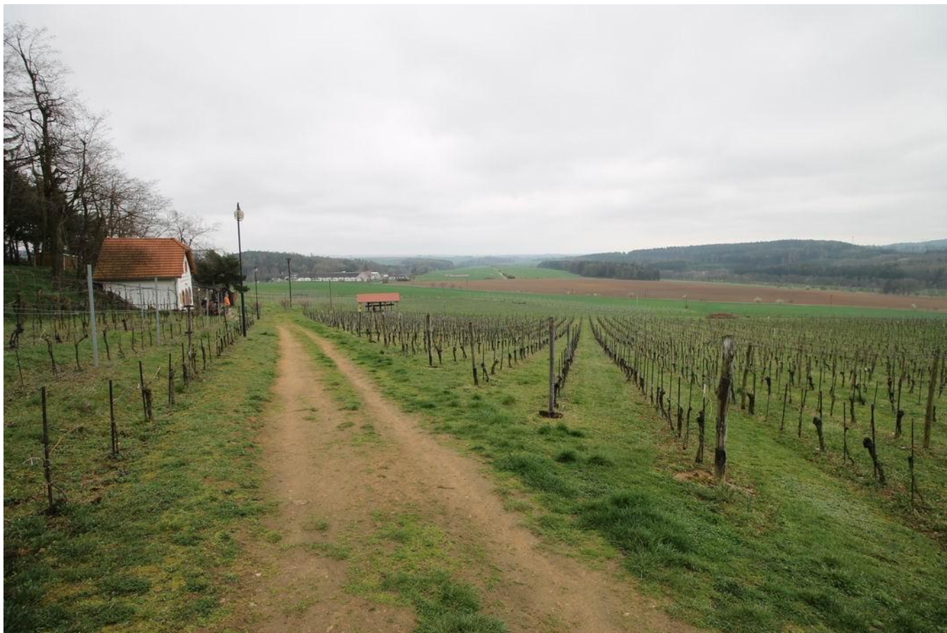
368 vinice na Sádku