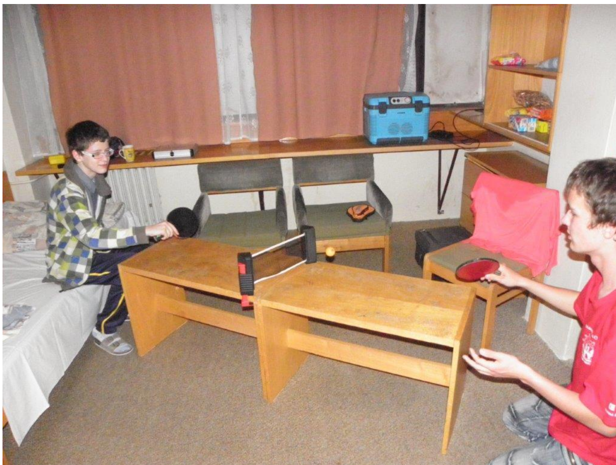
316 pingpong jde hrát opravdu všude