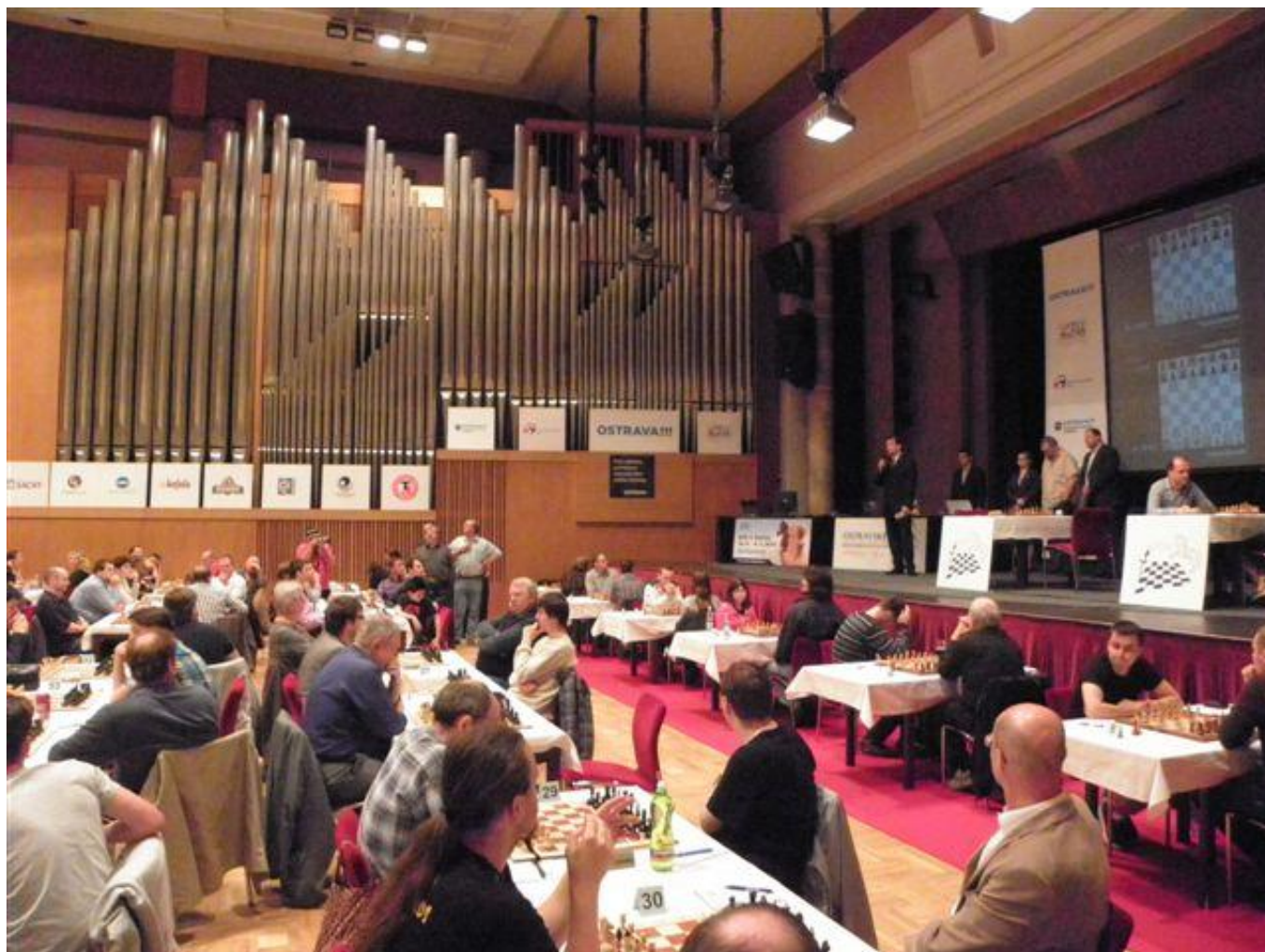
311 zahájení MČR