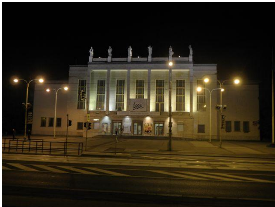
311 ostravský Dům kultury – dějiště MČR mužů a žen 2014