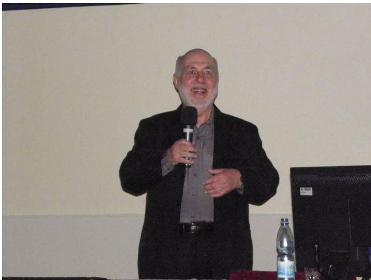
311 přednáška velmistra Lubomíra Kaválka, několikanásobného mistra ČR i USA a sekundanta mistra světa Roberta Fischera