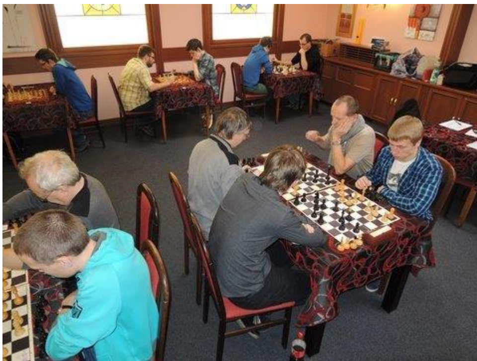
331 blicáři v hotelu Hajčman