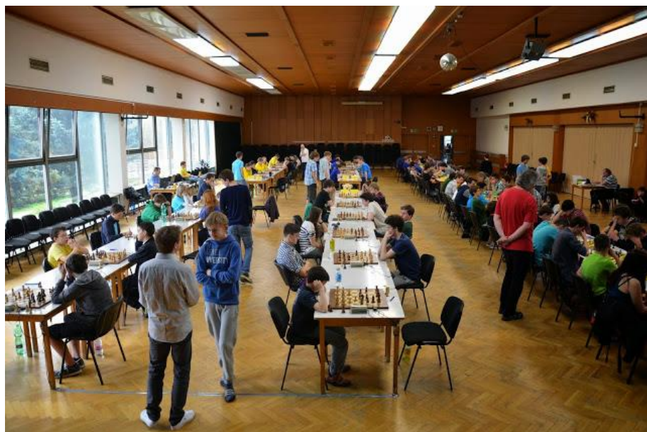
310 finále ELD v Třešti