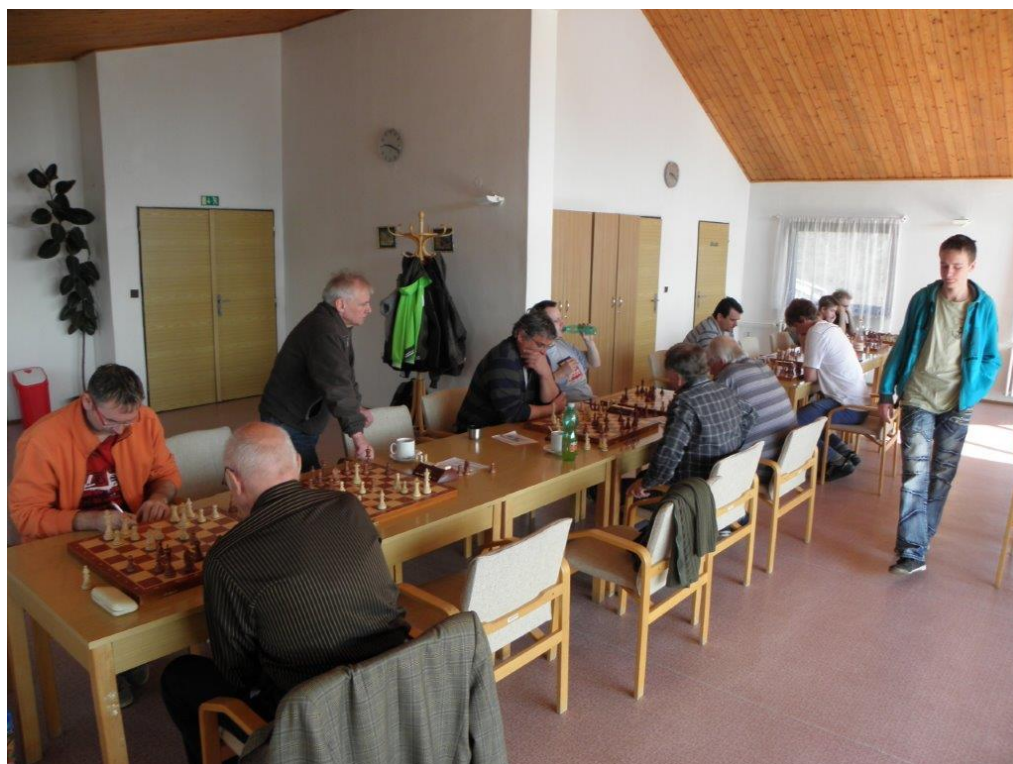
306 domácí zápas 8. kola KP proti jihlavským