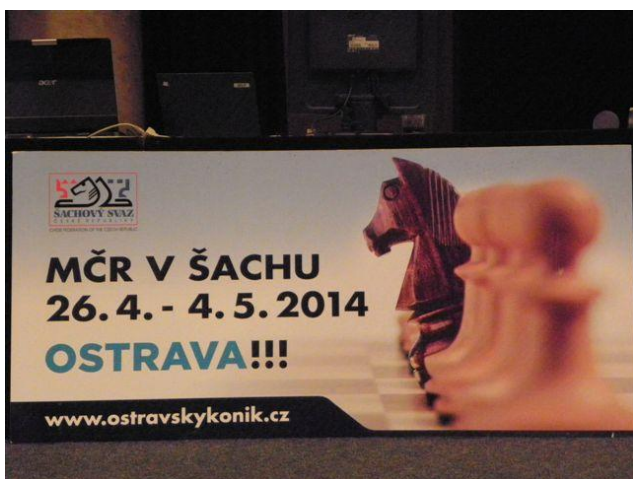
311 poutač pořadatele a Šachového svazu České republiky