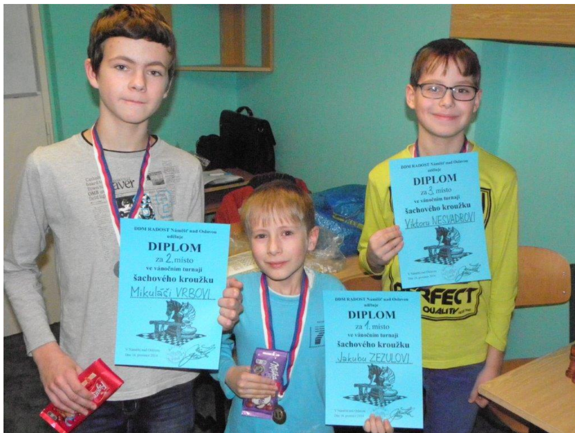
330 Vánoční turnaj v DDM na ulici Nové