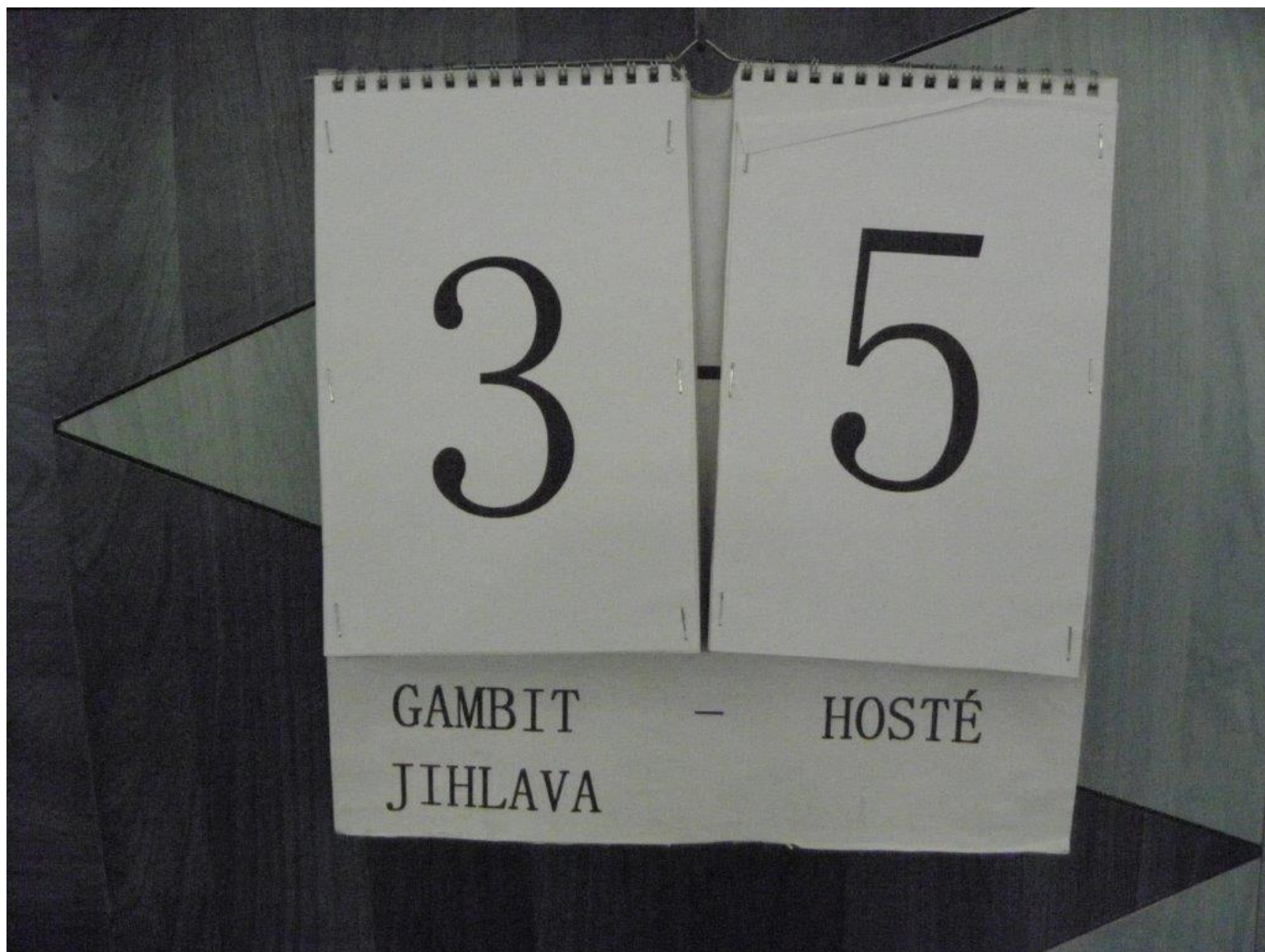
328 počítadlo průběžného výsledku zápasu