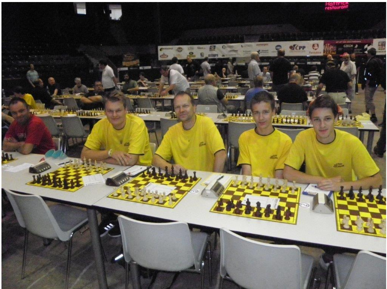
319 Náměšť na MČR 4-členných družstev