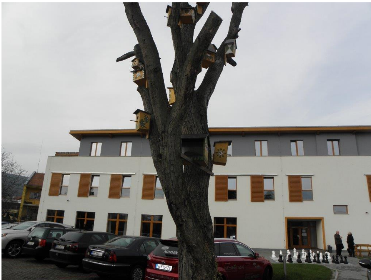
329 AS klub Brno, dějiště MČR v bleskovém šachu