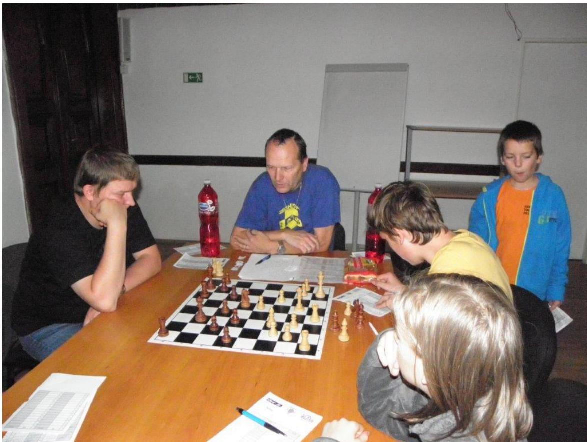
322 rozbory partií