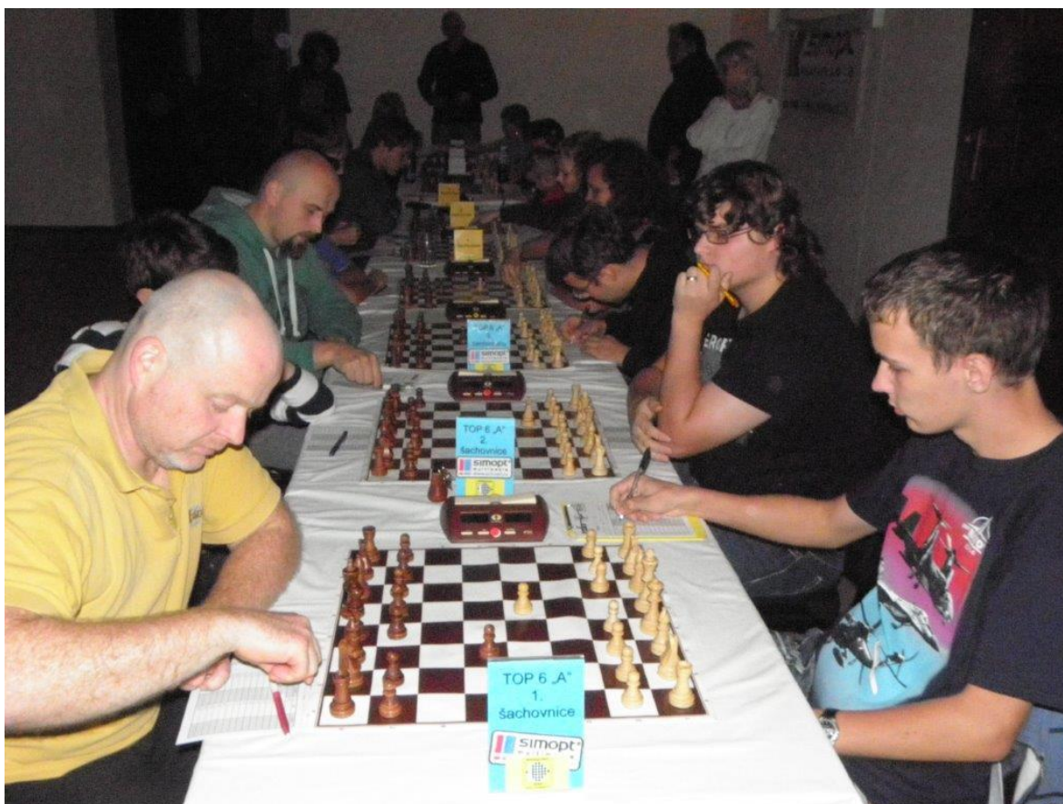
322 skupina TOP 6 „A“