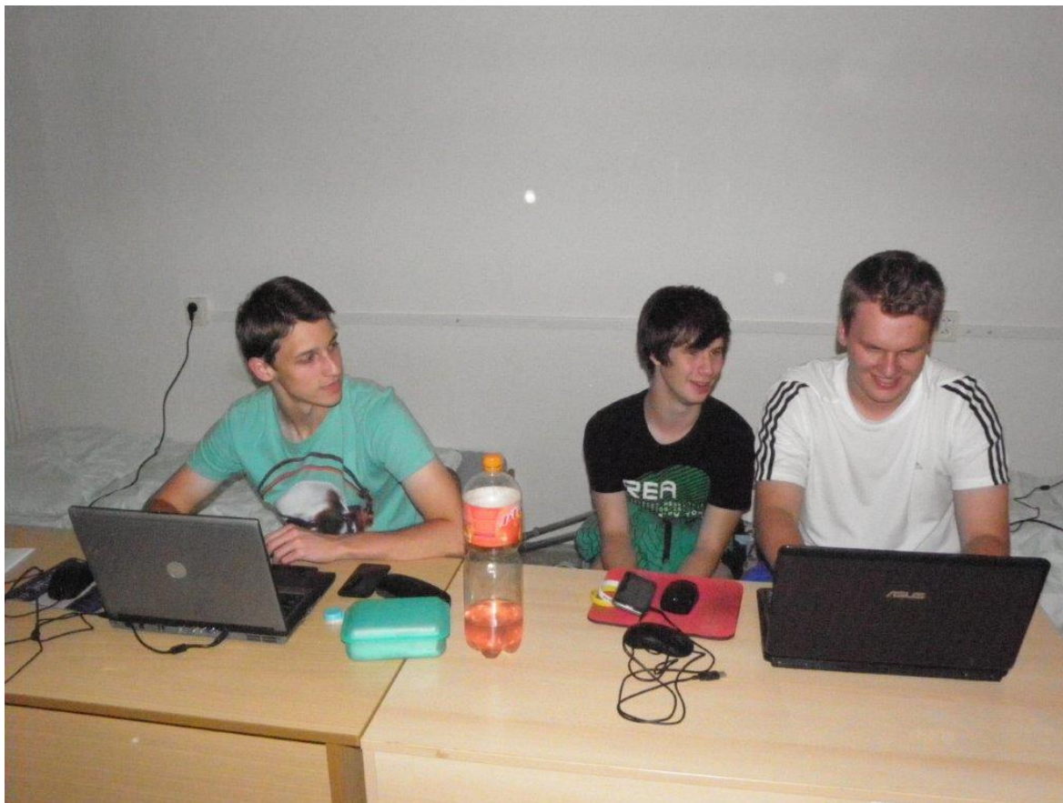
319 ve volném čase