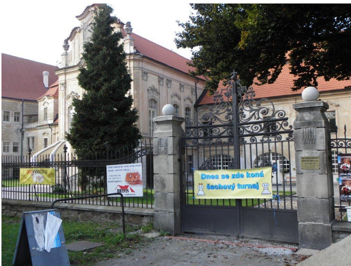
322 tady se hrají šachy dnes, zítra i pozítí