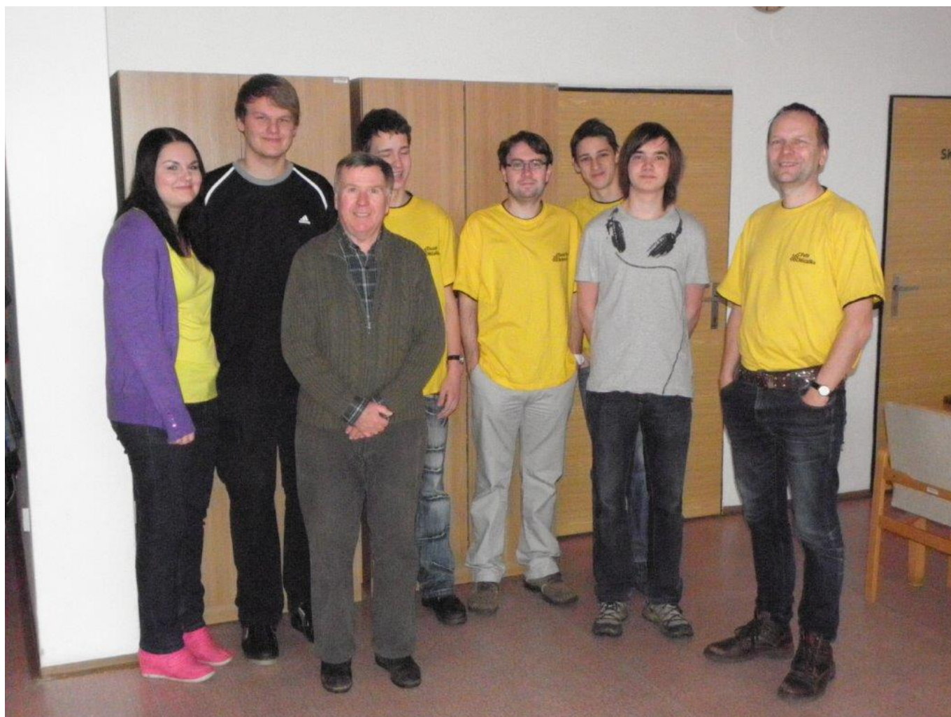
299 TJ Náměšť před zápasem 4. Kola KP družstev