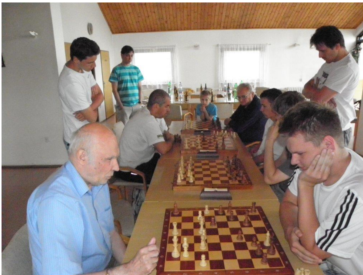
318 z bleskového turnaje