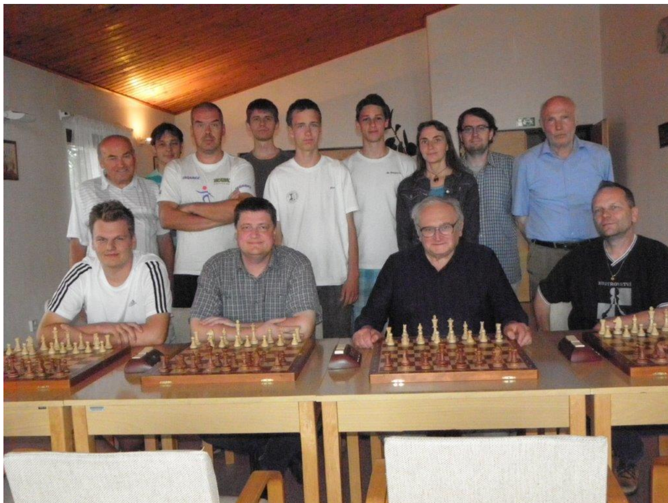
318 společné foto z rozlučky