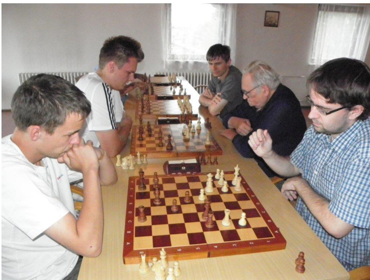
318 z bleskového turnaje