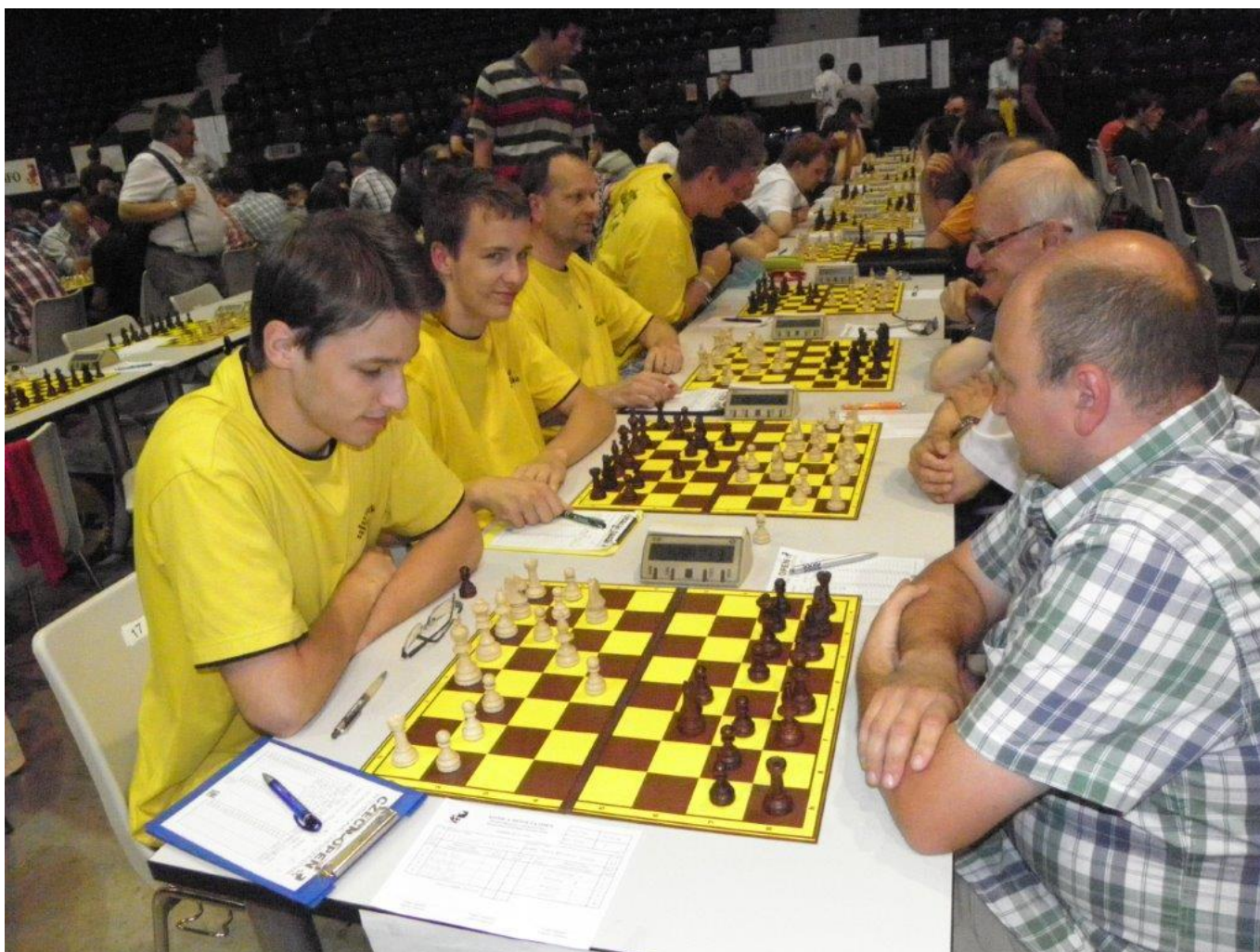
319 Náměšť ve žlutých dresech