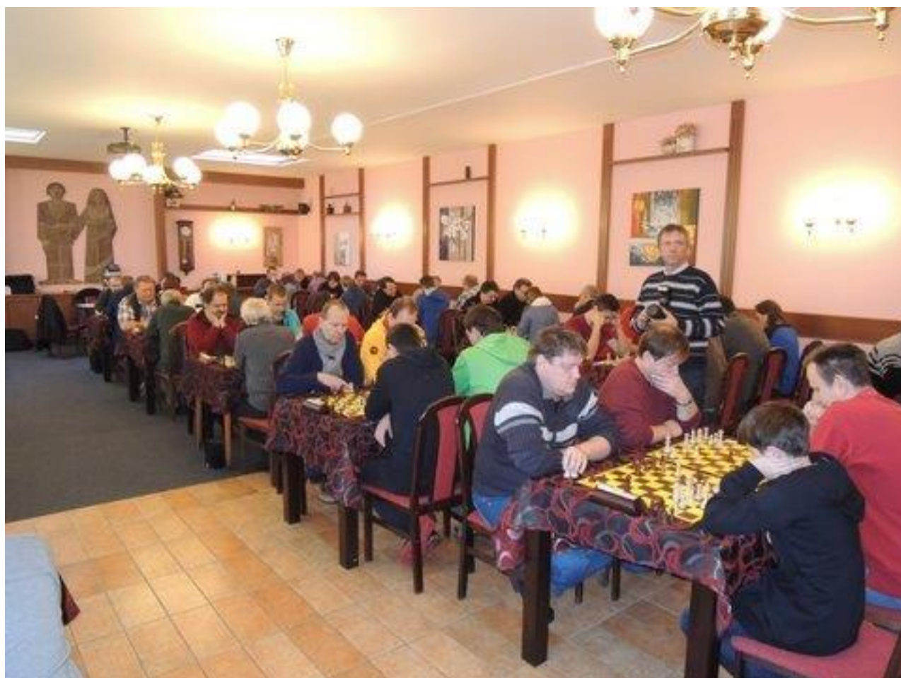
331 KP v bleskovém šachu ve Žďáru