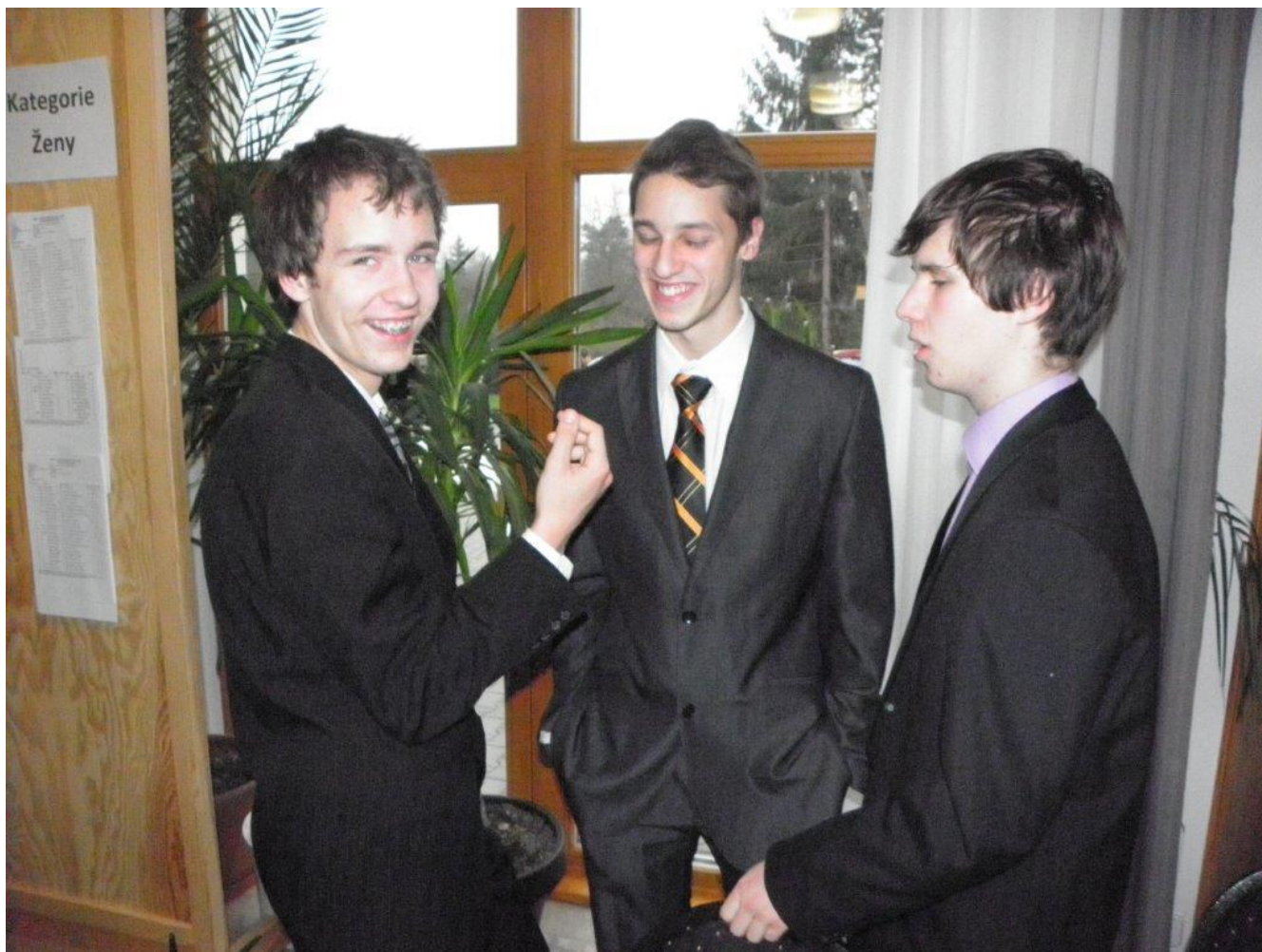
329 během turnaje je neopuštěla dobrá nálada