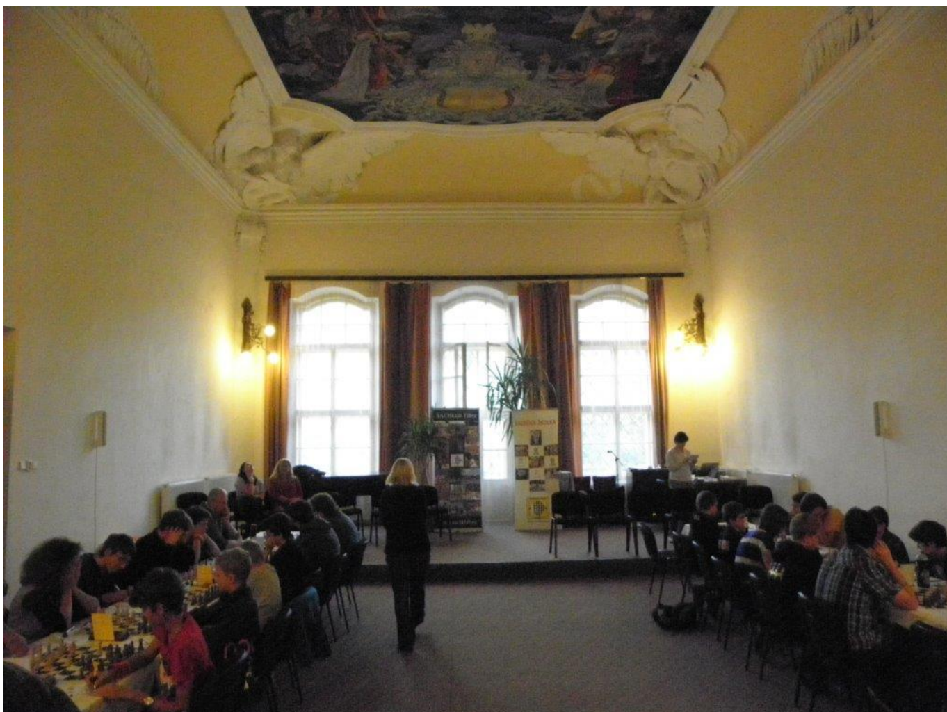
322 nádherný sál „Ceské nebe“