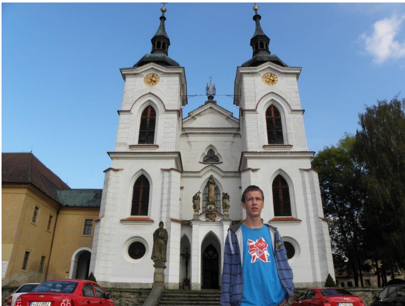
322 klášter Želiv