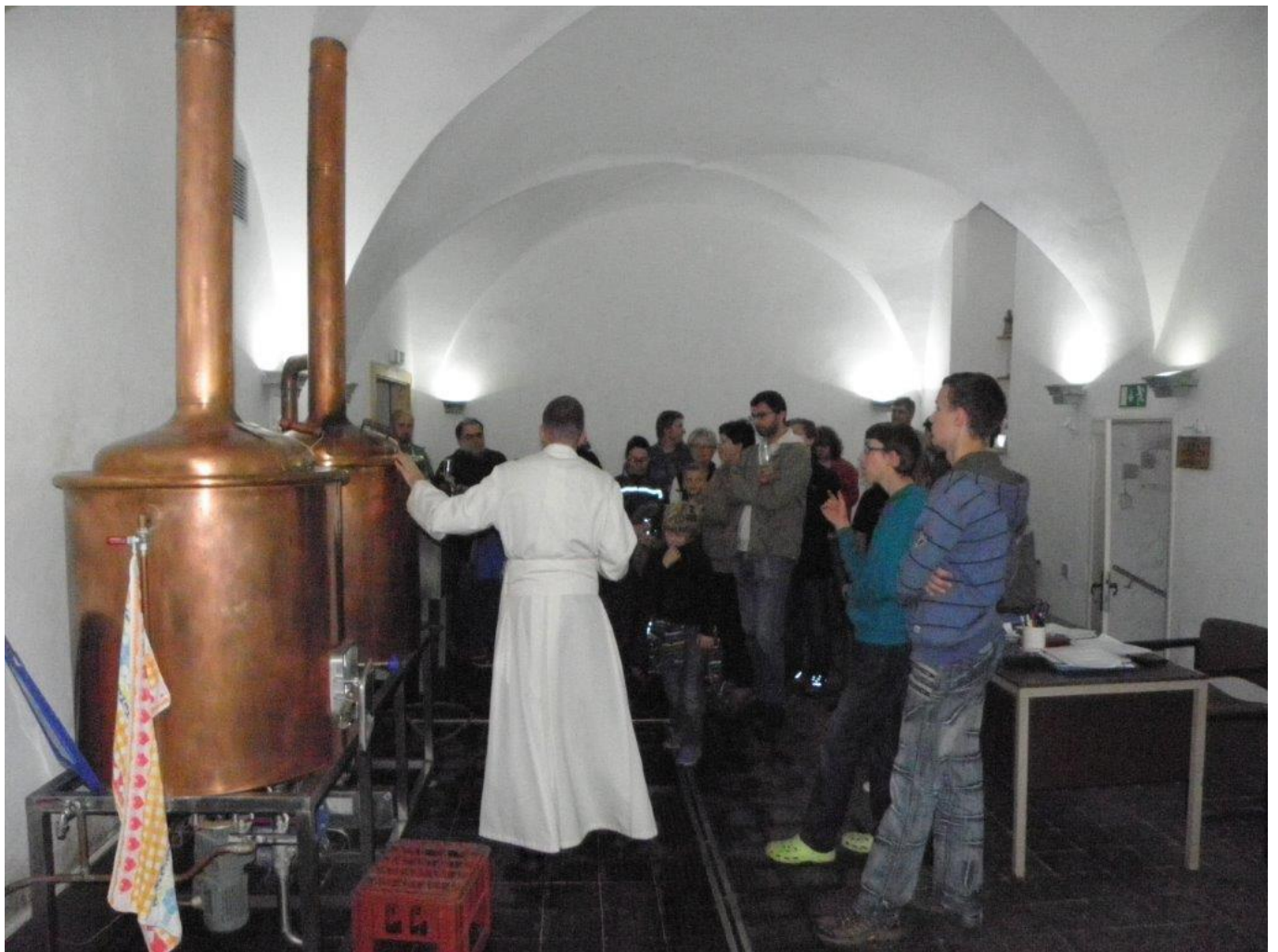
322 prohlídka klášterního pivovaru