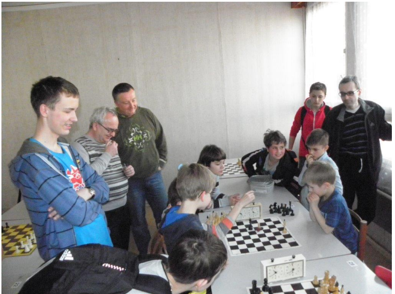
305 Kubova partie vzbudila velkou pozornost