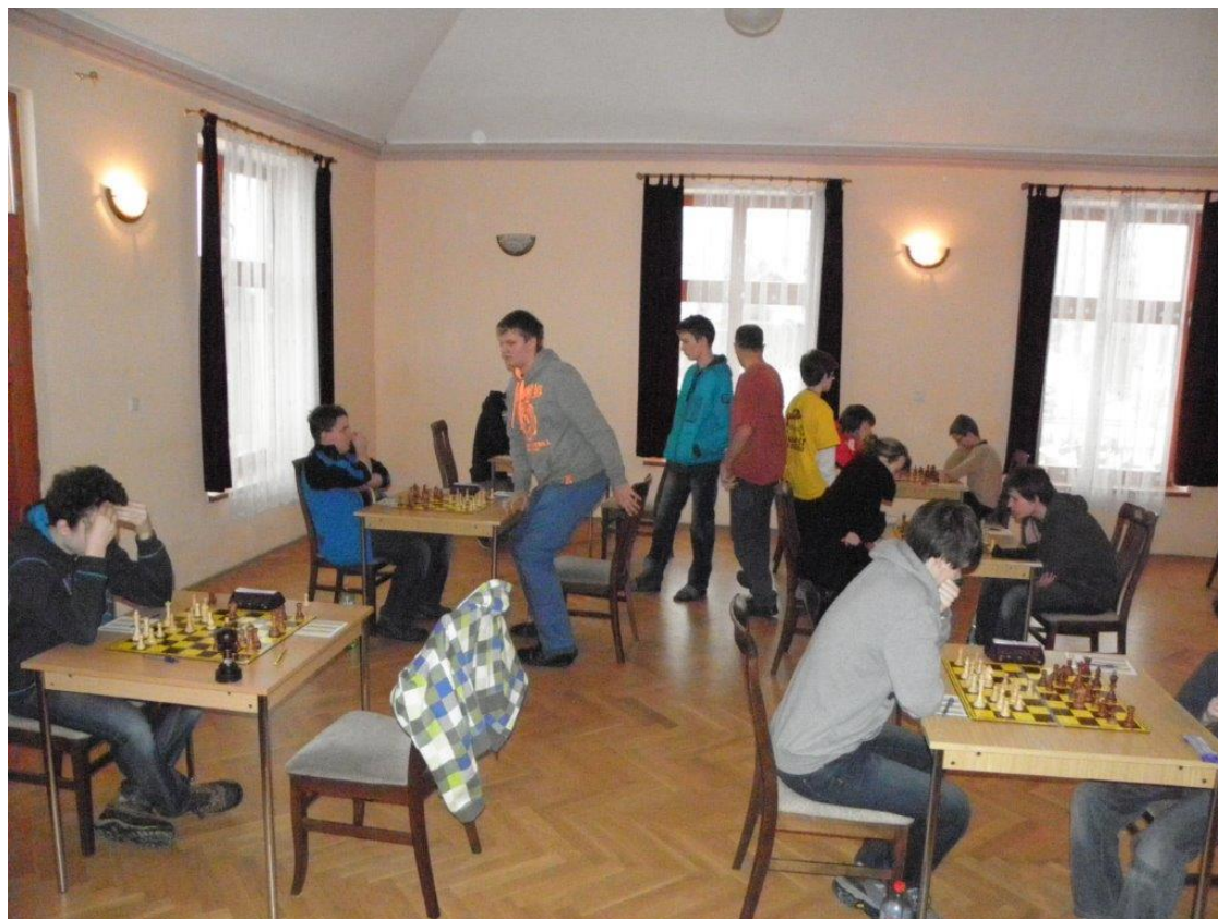
269 hrací místnost v Kuněticích