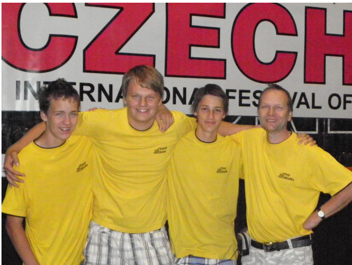
285 družstvo Náměště na MČR 4-členných družstev