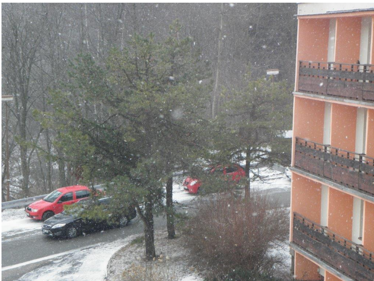
274 venku zrovna sněžilo