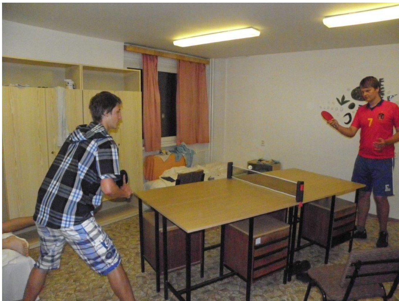
285 improvizovaný pinec na kolejích