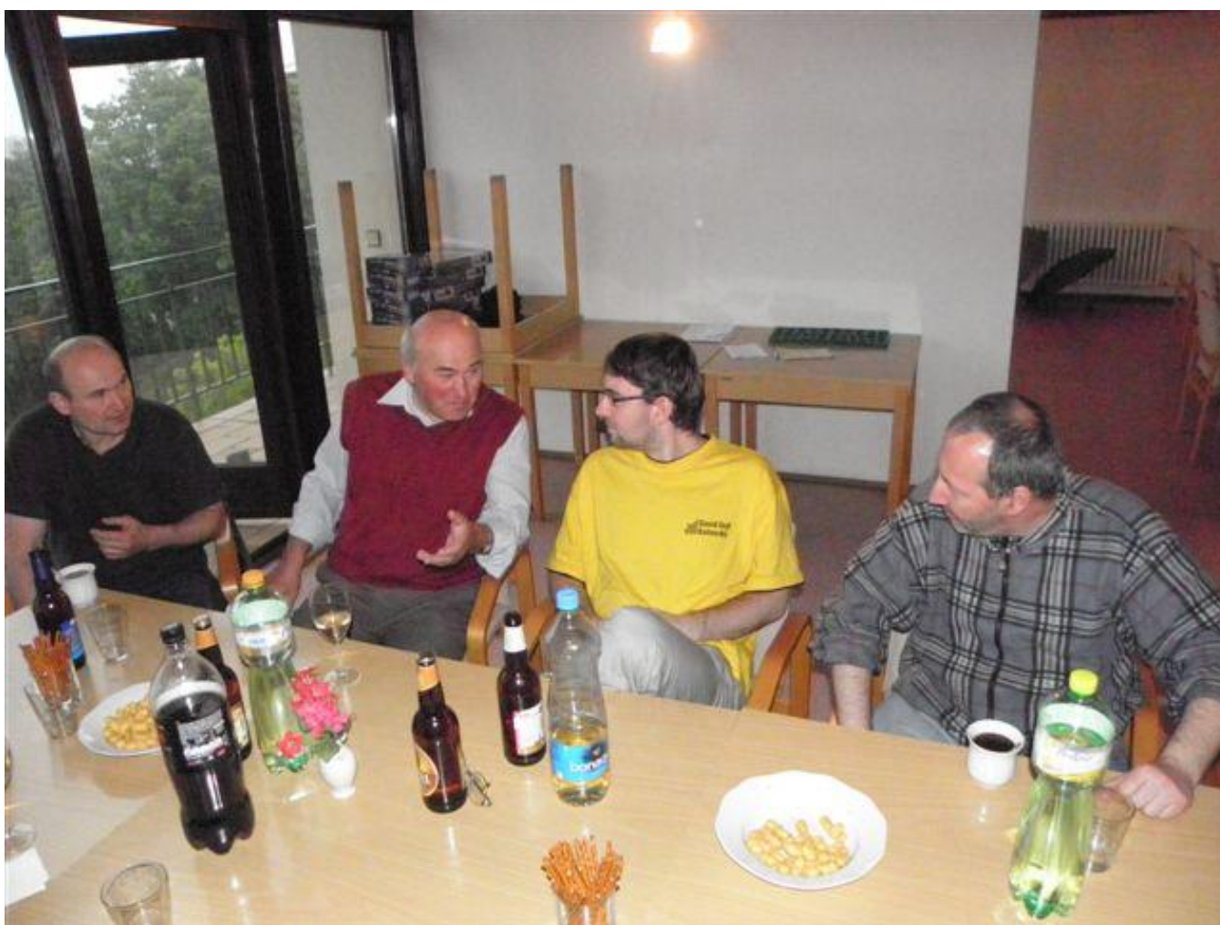
281 rozlučka se sezónou