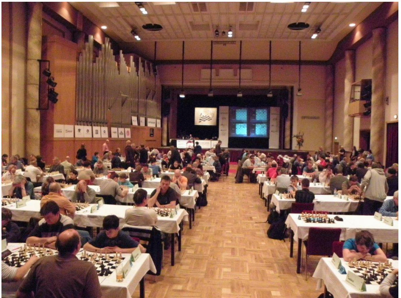
279 hrací sál v Ostravě