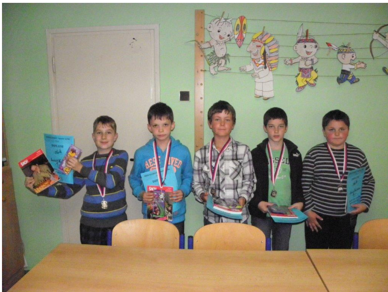
283 závěrečný kroužek DDM s turnajem