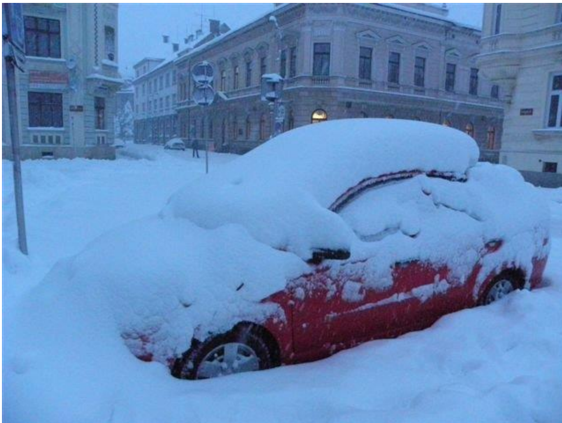
276 sněhová nadílka před Národním domem ve Frýdku-Místku