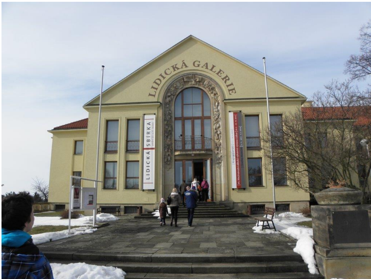
272 místo konání sportovně-kulturně-společenské akce Lidická simultánka