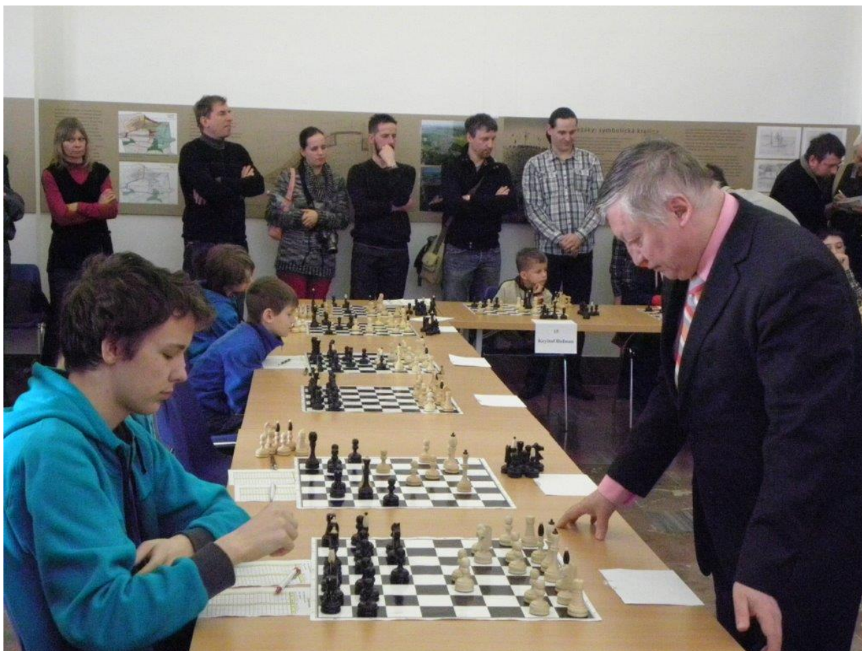
272 David proti Karpovovi