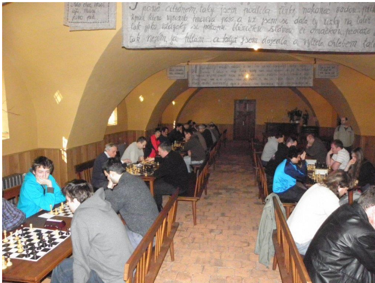
273 turnaj v pivovaru v Dalešicích