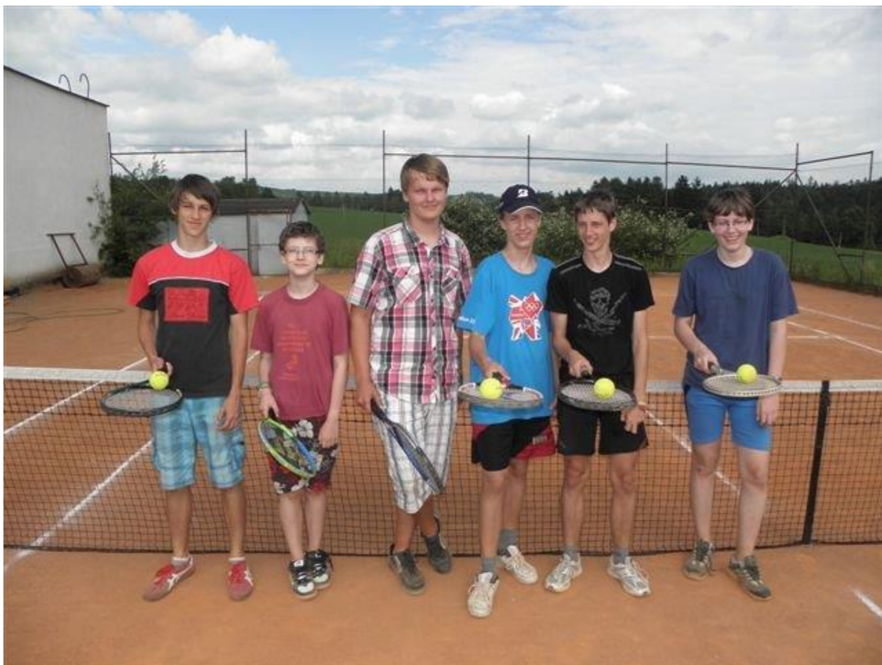
284 druhá fáze přípravy u Krčílů