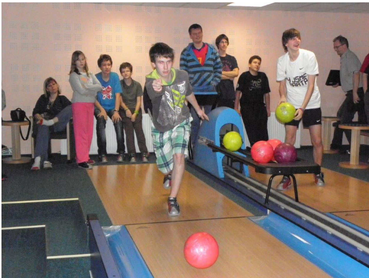
274 zábava na bowlingu