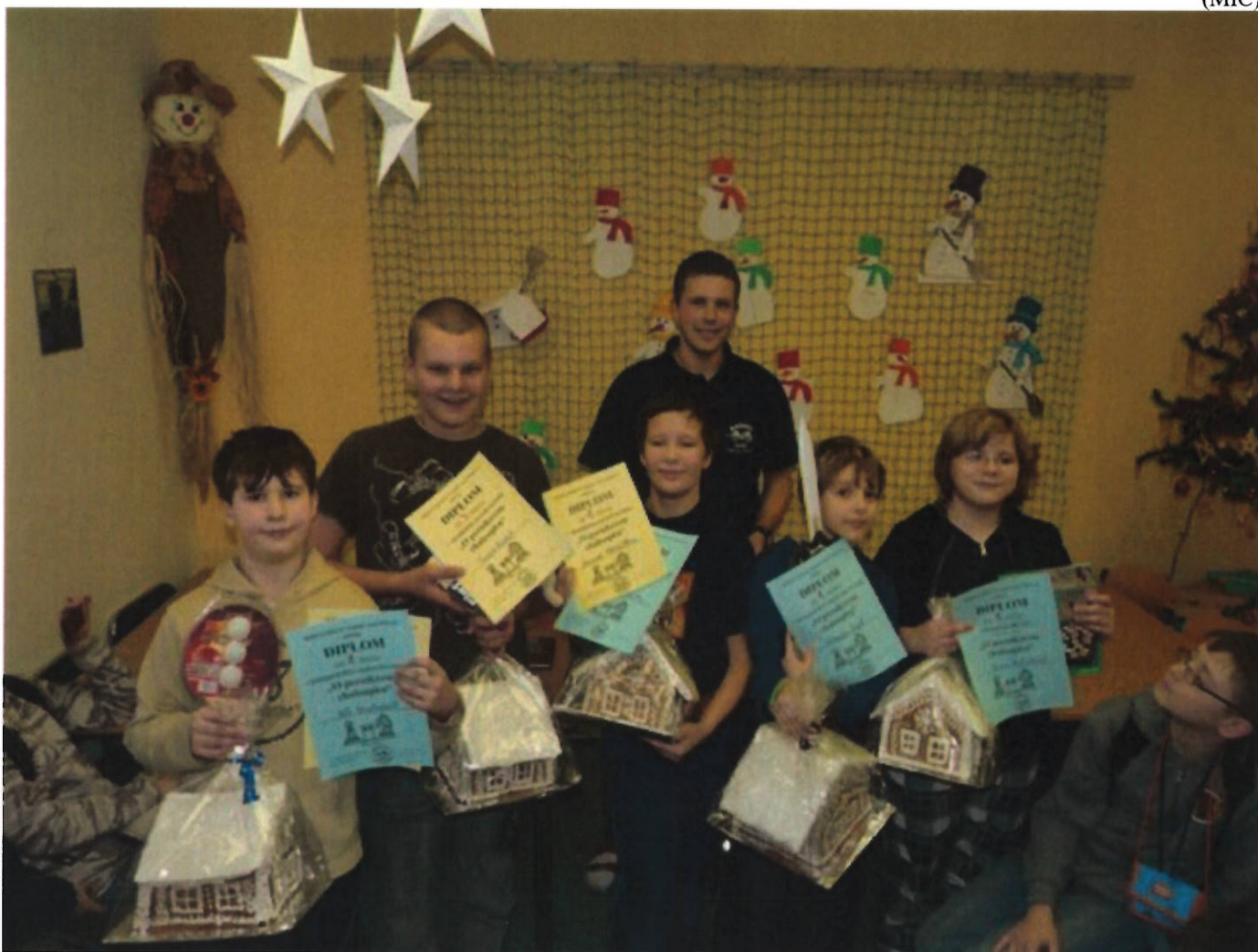
177 perníkoví chalupáři