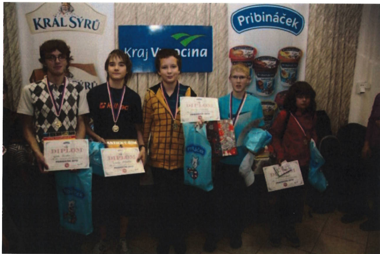
202 Přibináček – vítězové kategorií