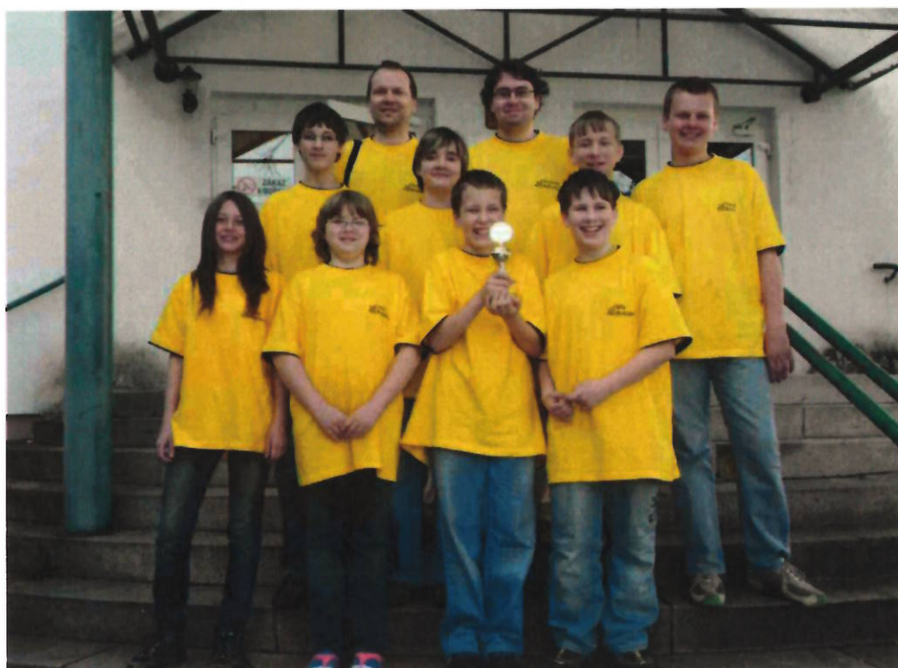
186 Náměšť vyhrála 1.ligu a bude hrát Extraligu dorostu !!!