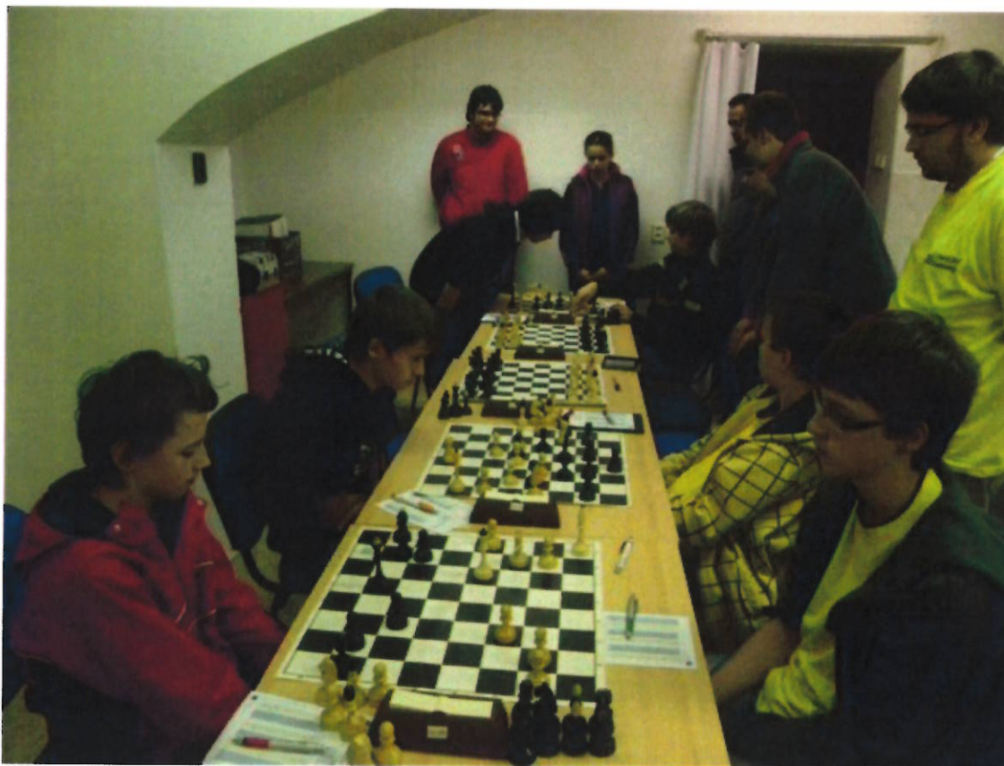
198 první 4 kola Extraligy v Brně