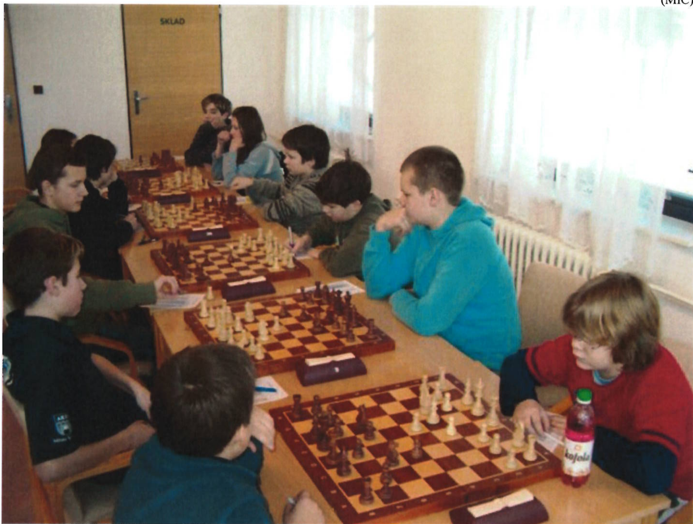
178 Náměšť v zápase 1. ligy s Vlašimí