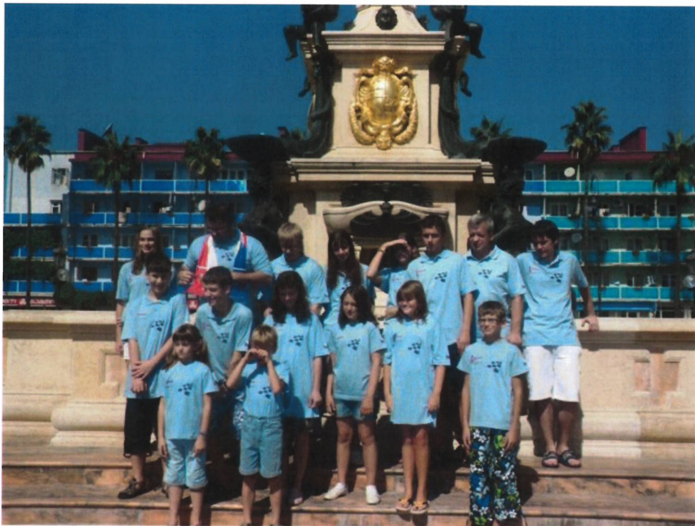
197 výprava ČR na ME v Gruzii (Batumi)