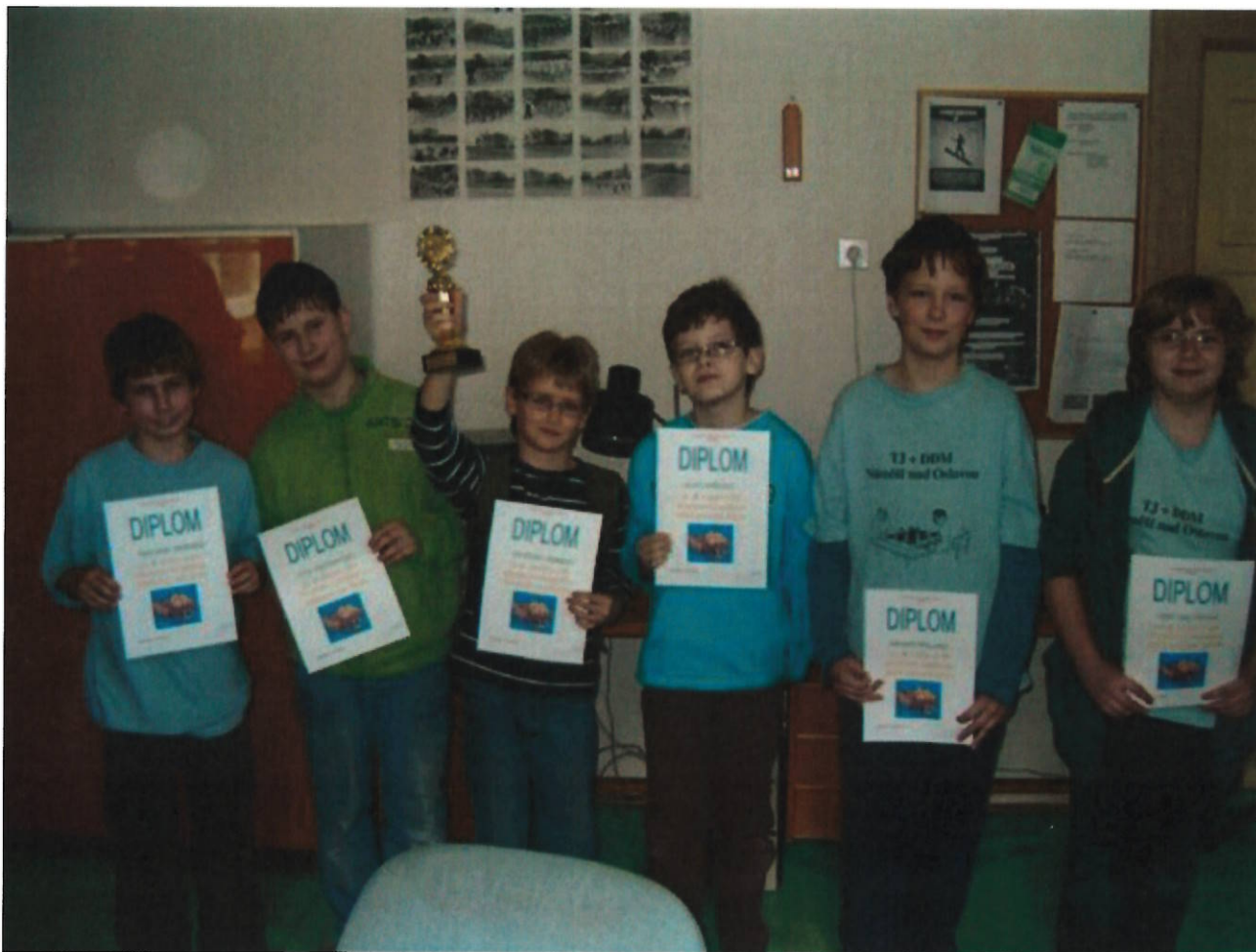
182 Náměšť mladší žáci