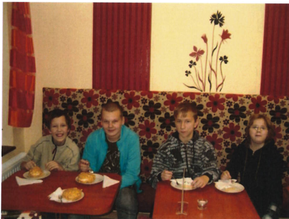
177 oslava v cukrárně u Ráčků