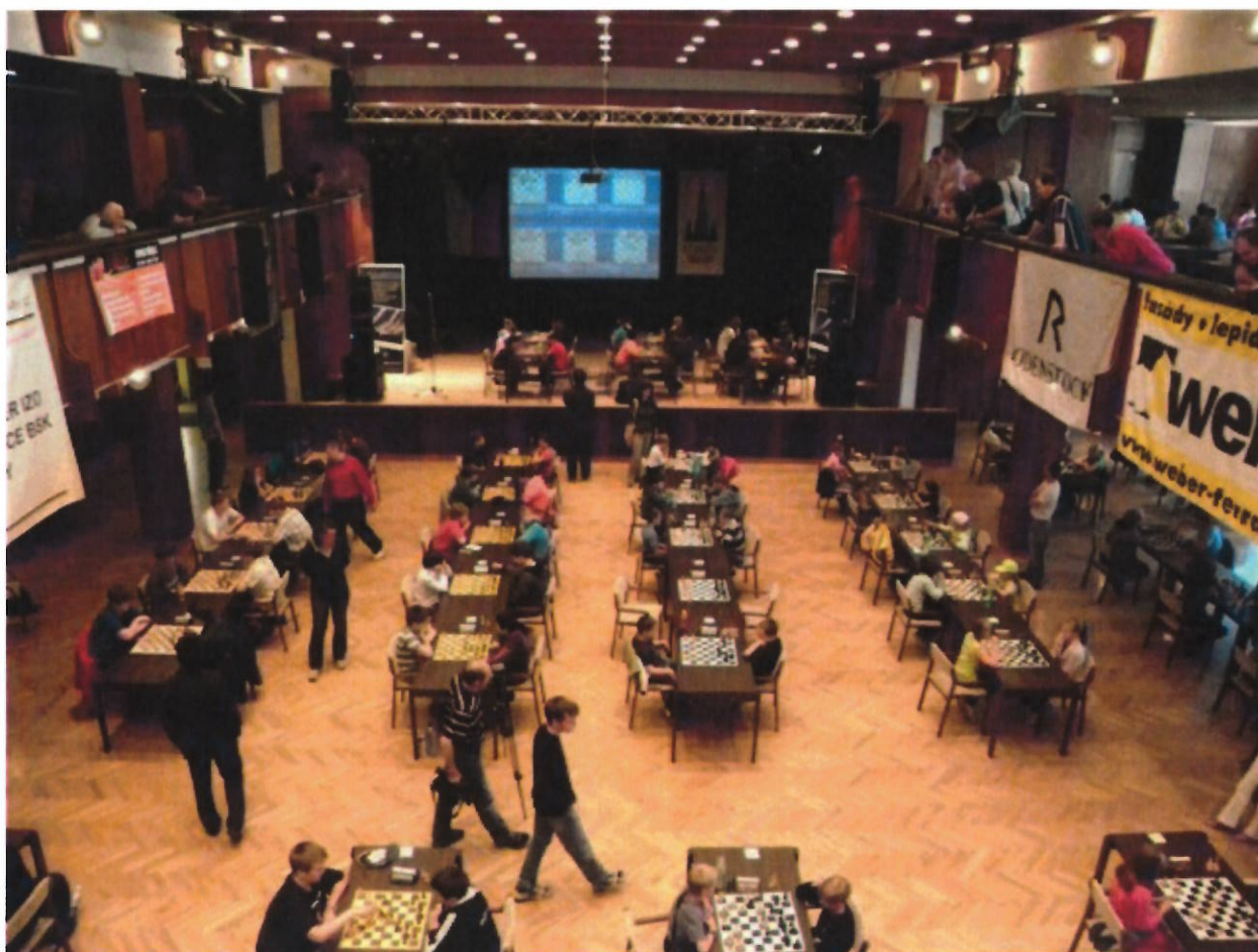
195 MČR mládeže v rapid šachu Klatovy