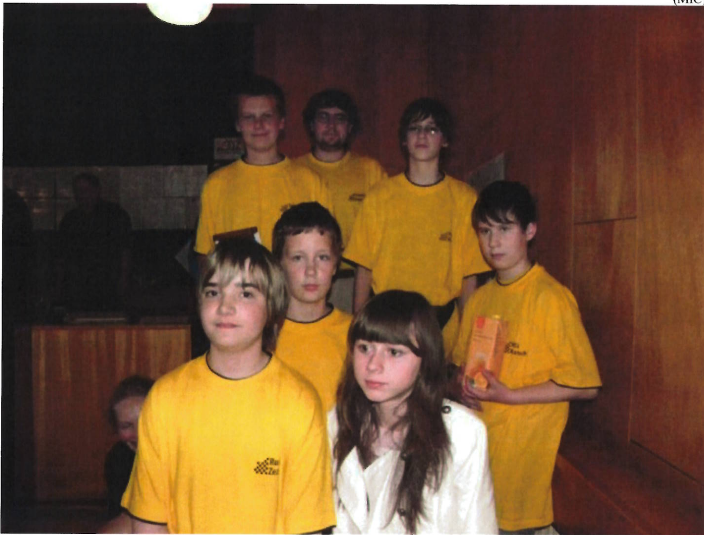
189 družstvo starších žáků