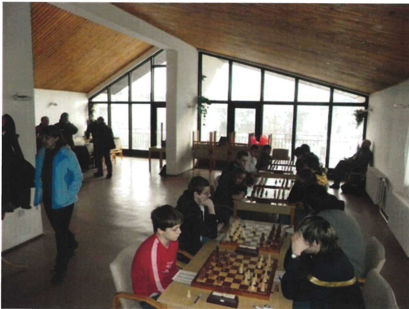
203 ELD 5.kolo v Náměšti