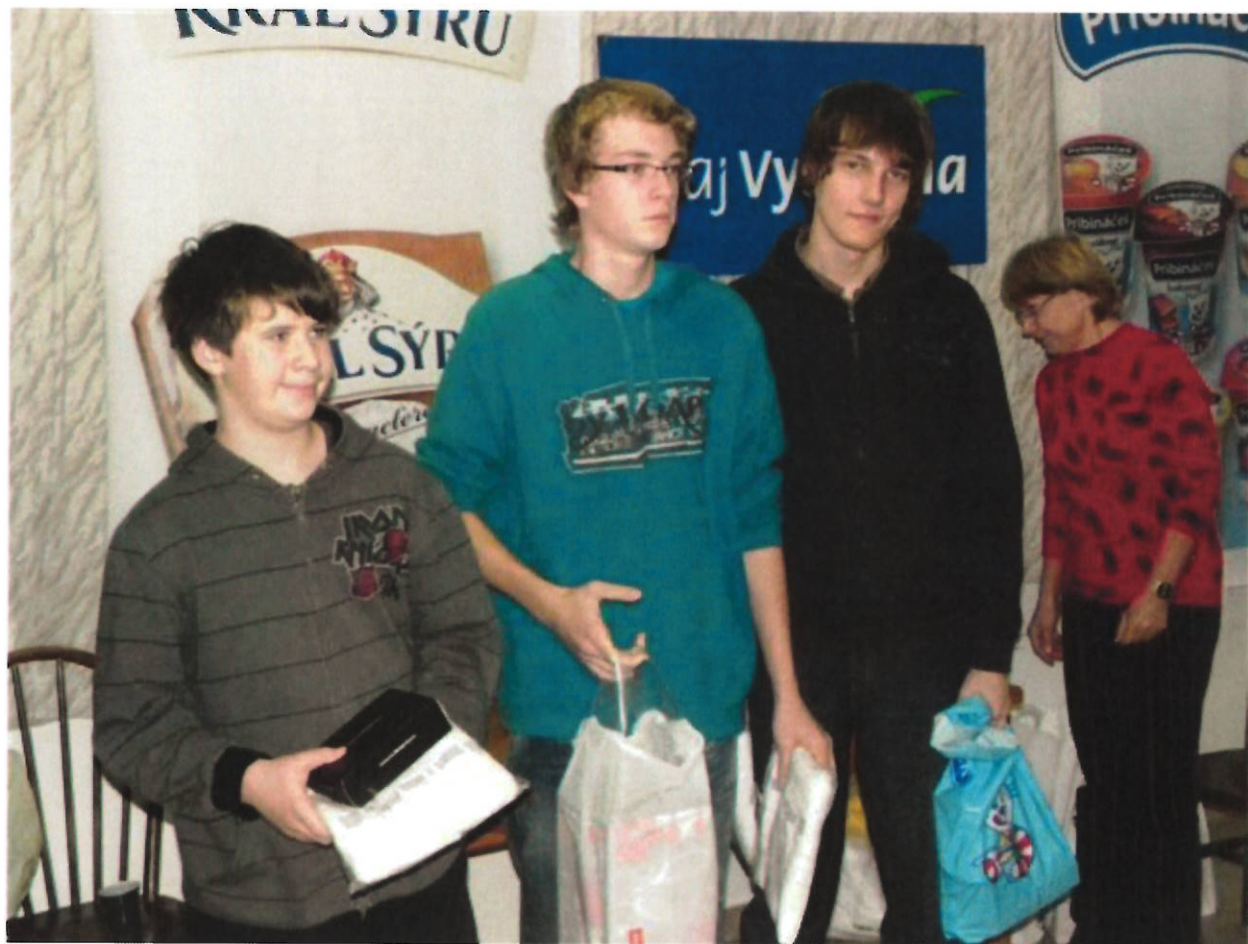
202 Open Přibyslav