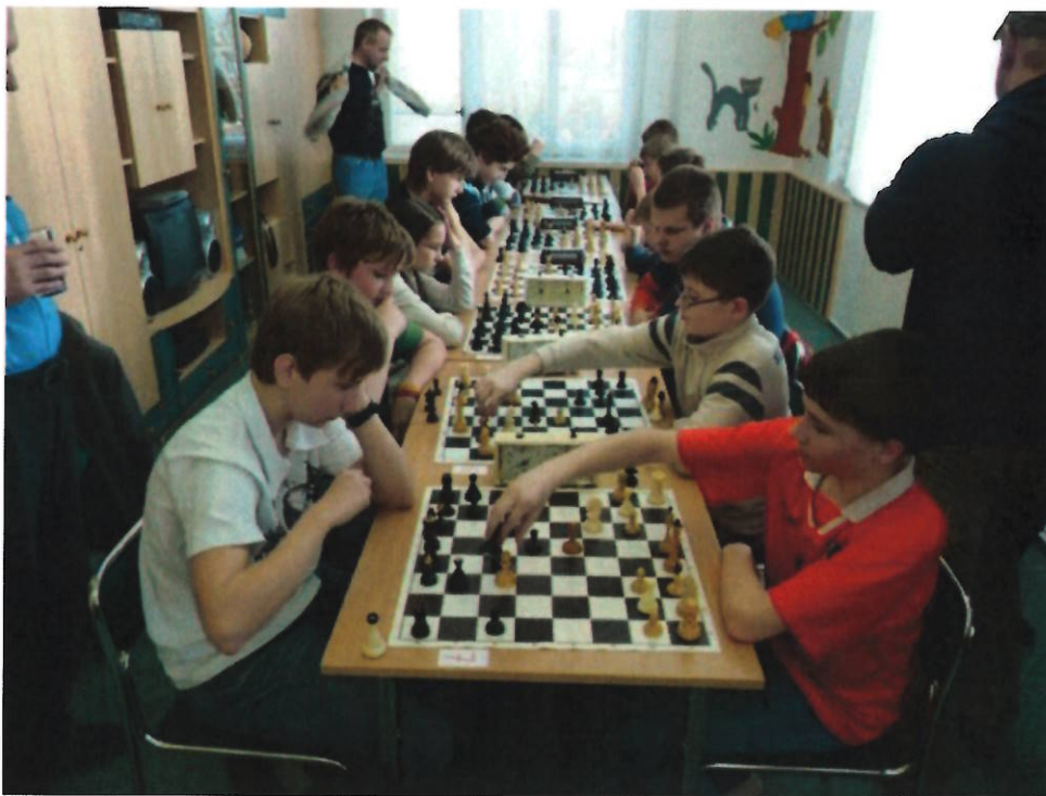
184 o velikonočního beránka