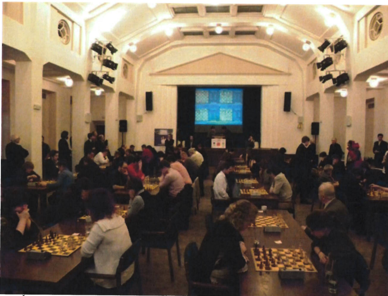
206 MČR v bleskovém šachu, Praha