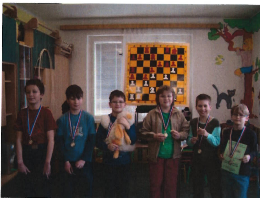
153 Náměšť mladší žáci

Vítězné družstvo postupuje na MČR družstev mladších žáků 2008 v Sezemicích.