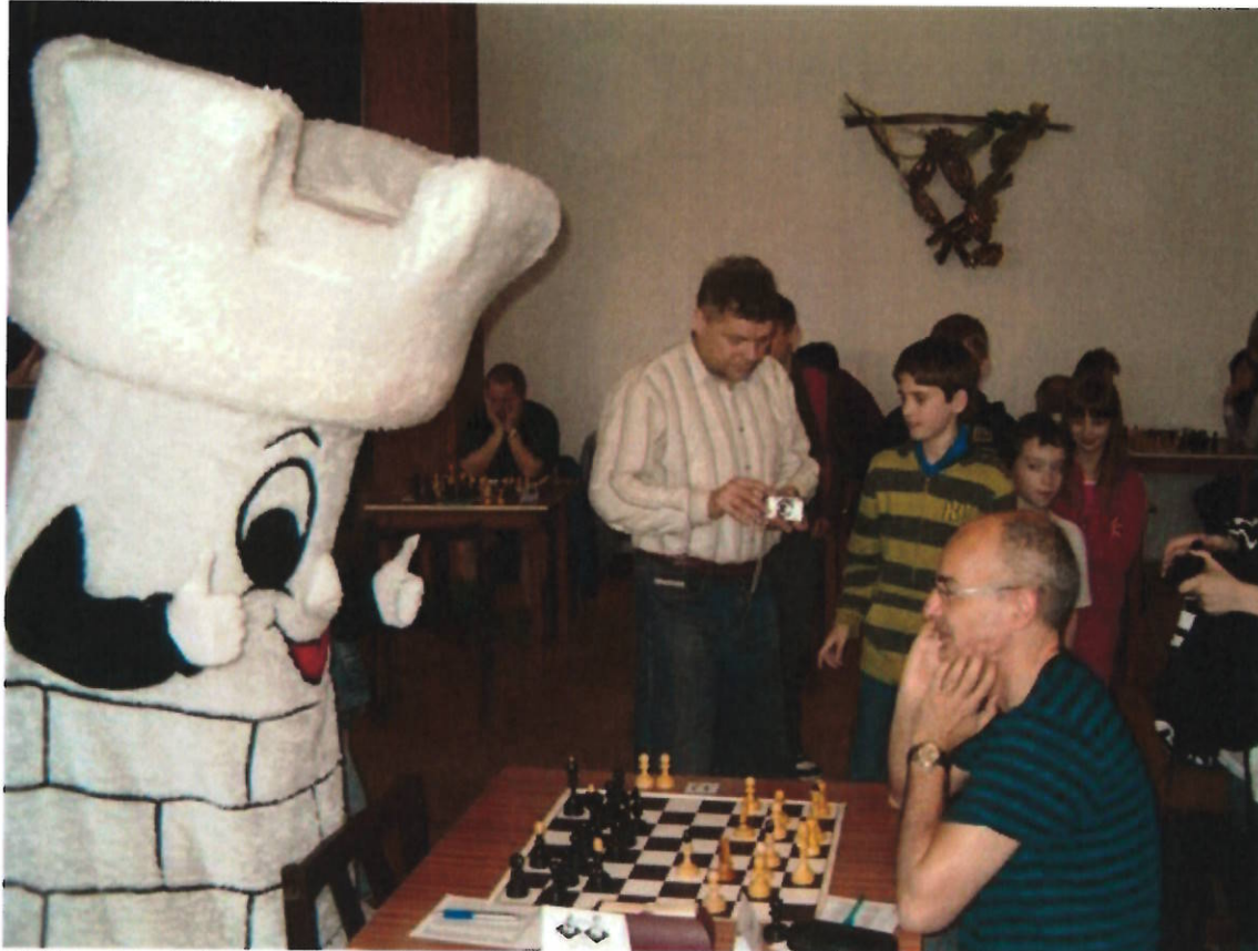
155 Frymík v akci