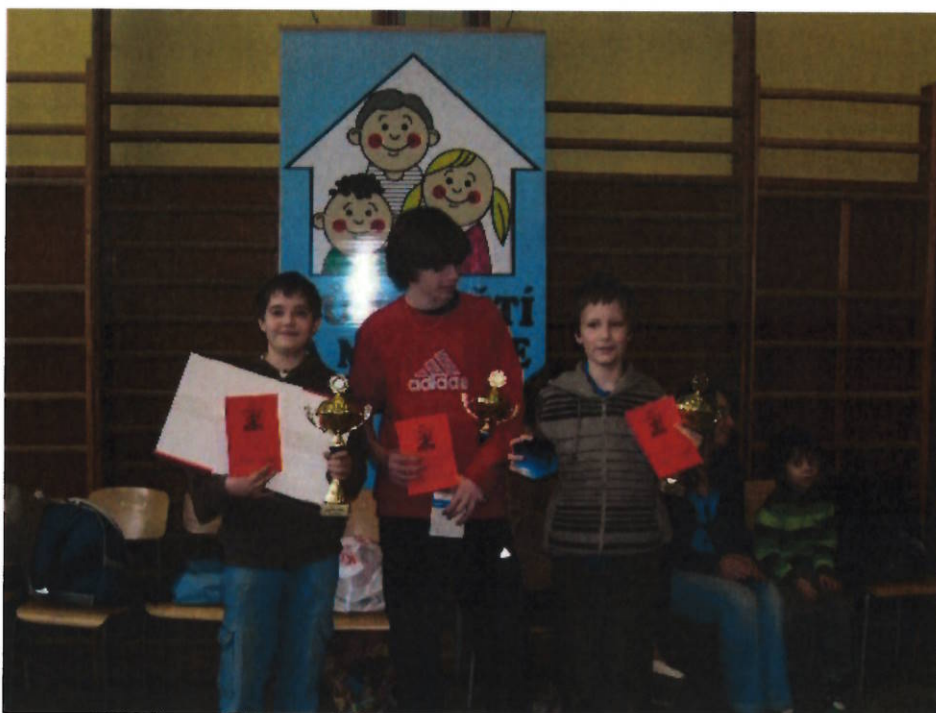
156 vítězové v Šumné