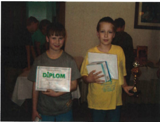
159 vítězové H12