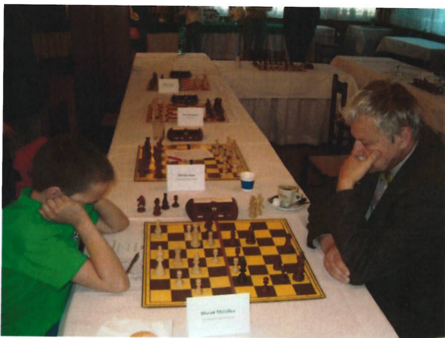
158 GM Vlastimil Hort