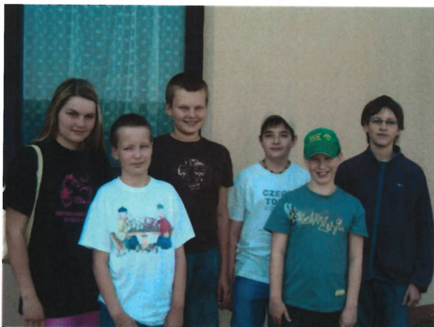
157 mladší dorost TJ Náměšť nad Oslavou