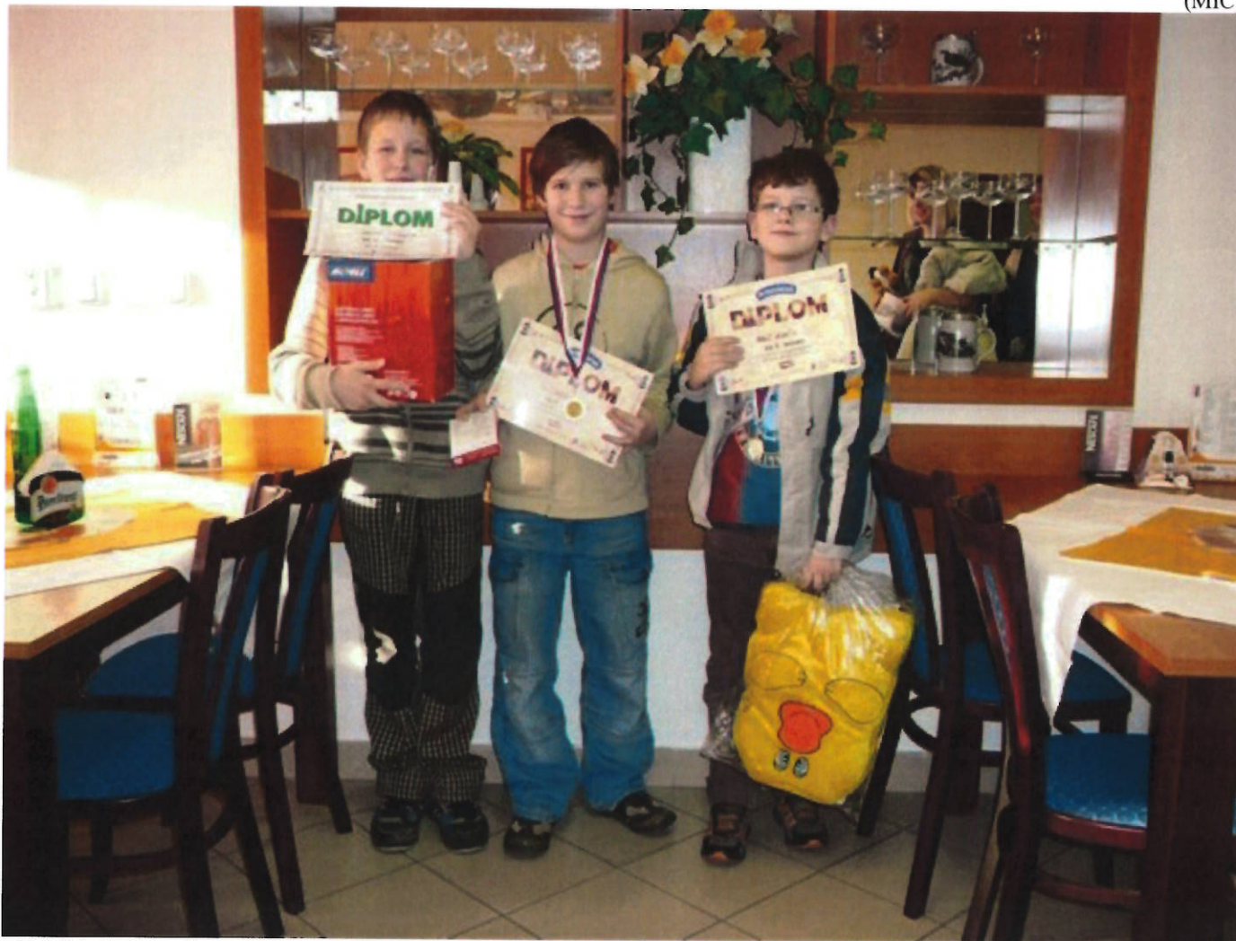
172 Pribináček – nejlepší trojice