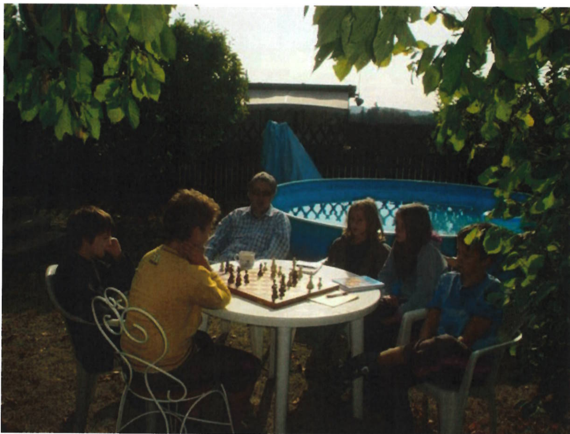
167 Davidova skupina