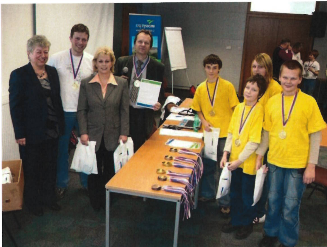
151 starší žáci ZŠ Husova 1. místo

Postupujícím družstvům přejeme na republikových kolech hodně hezkých sportovních výsledků a dobrou reprezentaci Vysočiny! (MIC)