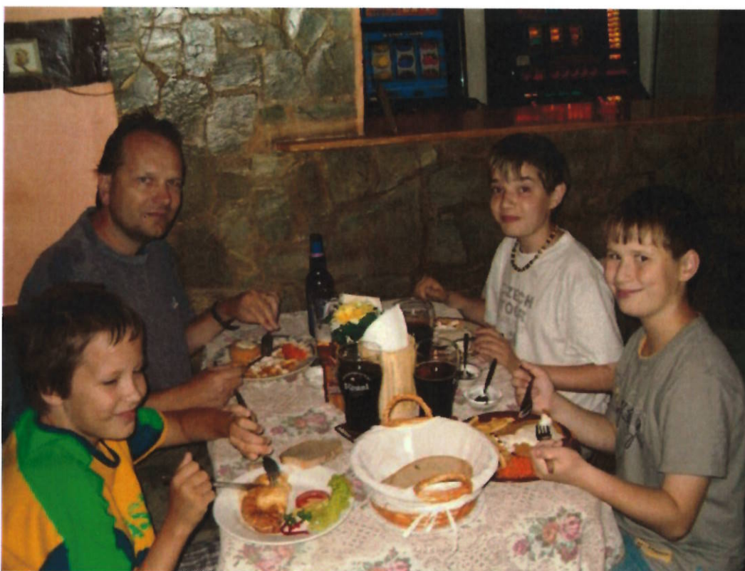
163 družstvo Náměšť