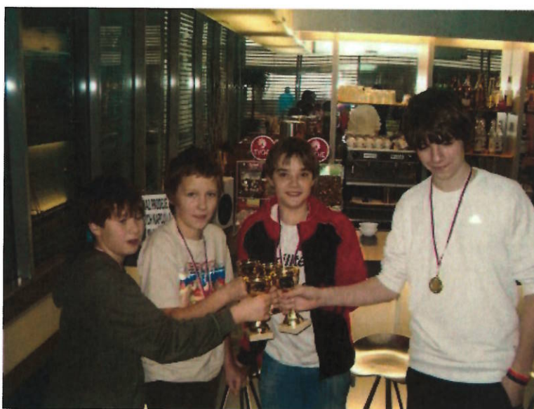
170 A ještě jednou, tentokrát přípitek všech čtyř vítězů.