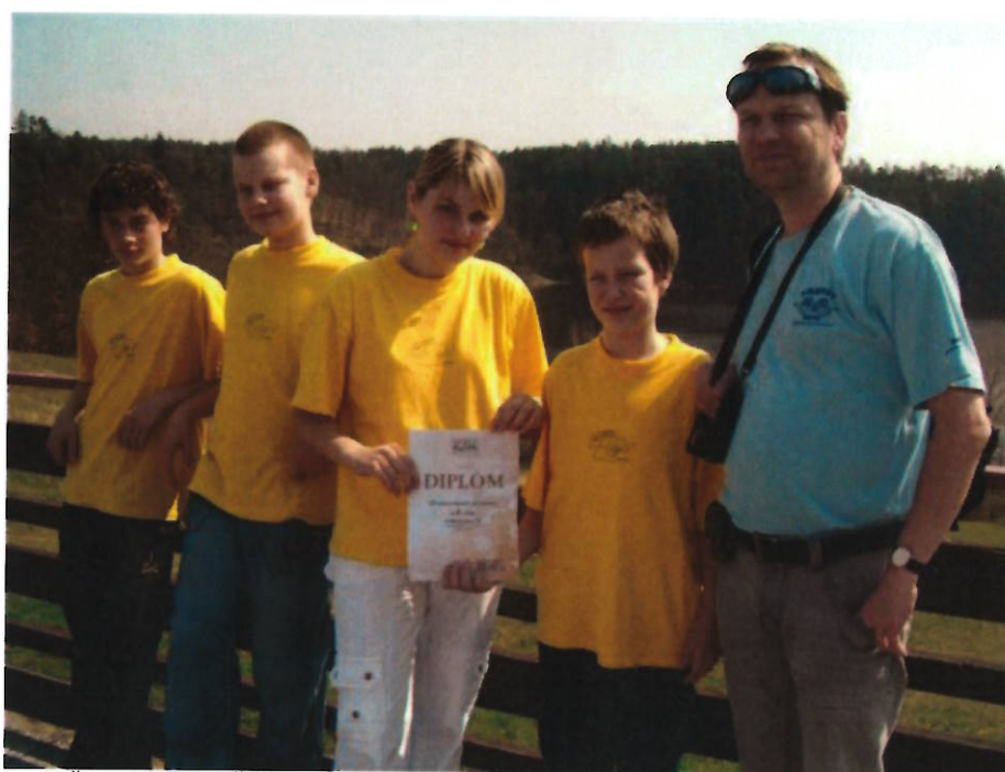
154 ZŠ Husova 6. v ČR