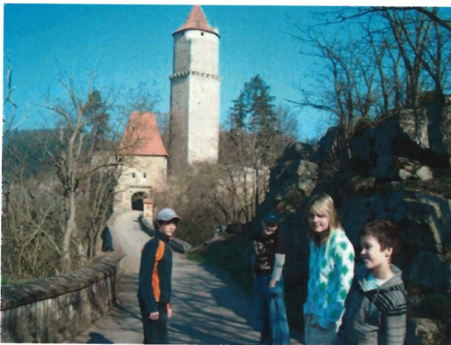
154 na Zvíkově