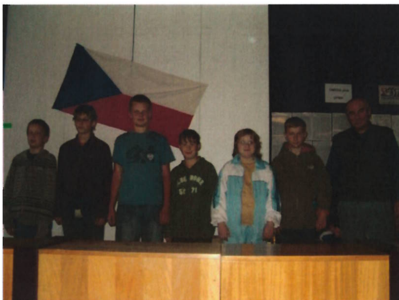
160 družstvo starších žáků