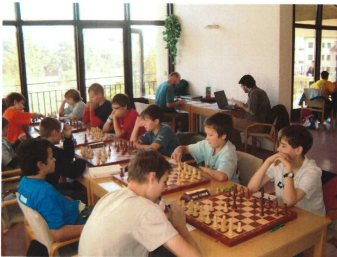
169 1.liga mladšího dorostu