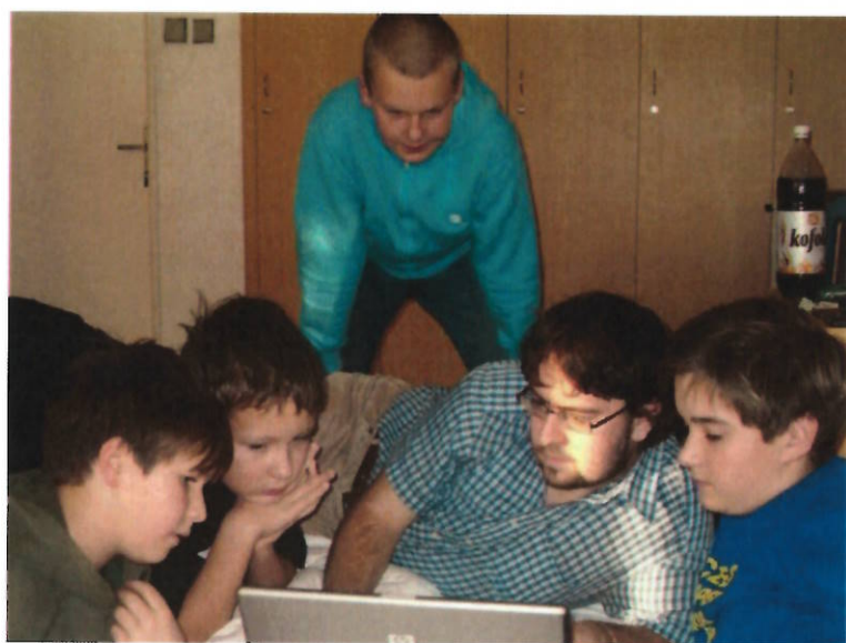
170 příprava na další kolo