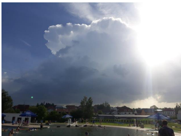
480 bouřkové mraky se blíží