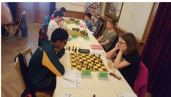
473 ... stejně tak Helena...