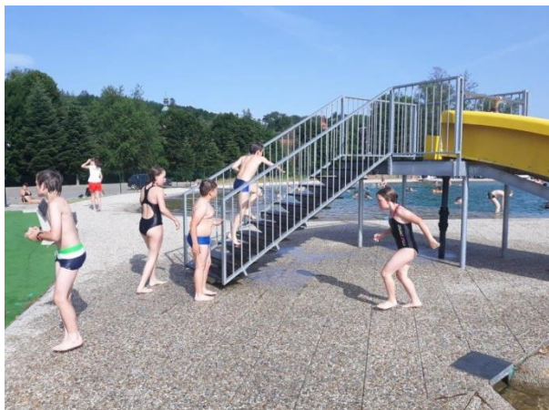
480 koupaliště v Třešti

Po sobotním 7. kole jsme byli na krásném 13. průběžném místě. Odpoledne jsme zamířili na místní přírodní koupaliště, kde jsme kromě koupání mohli pozorovat hezké bouřkové mraky a slyšet i hromy. Bouřka se Třešti ještě nepřiblížila, ale po večeri jsme se na večerní procházce museli na 5 minut schovat.