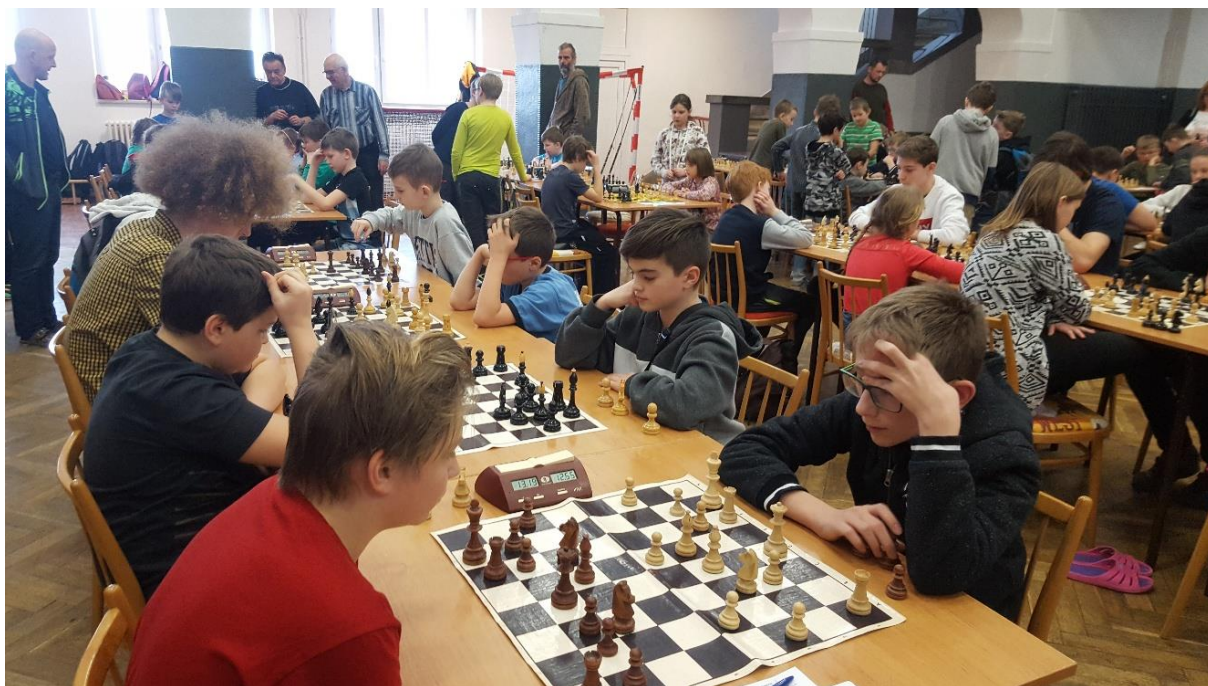
467 v KP škol poprvé v kategorii 6.-9.třída

svých zkušeností a prohrál na čas. Tím toto kolo 1:3. Ve 4 až 7 kole nás čekali nejsilnější soupeři z turnaje. I když se našim hráčům již několikrát na šachových turnajích Ligy Vysočiny podařilo své soupeře porazit, tentokrát se to moc nedařilo. Ve čtvrtém kole prohráváme jasně 4:0. V kole pátém se daří remizovat jen Jakobovi na první desce a prohrávám 3,5:0,5 a v kole šestém opět prohráváme na plné čáře 4:0.