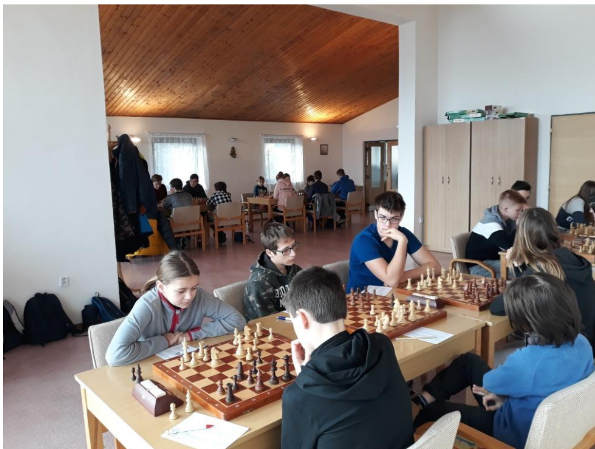
497 vzdušná hrací místnost v Penzionu