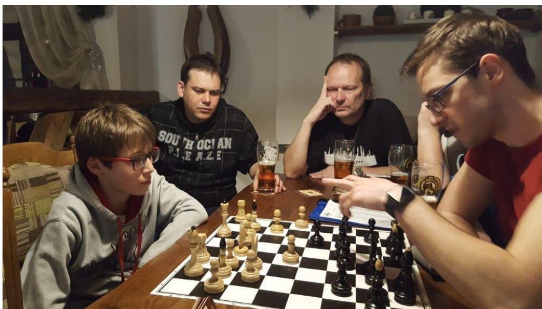
473 nezapomenutelné rozbory partií