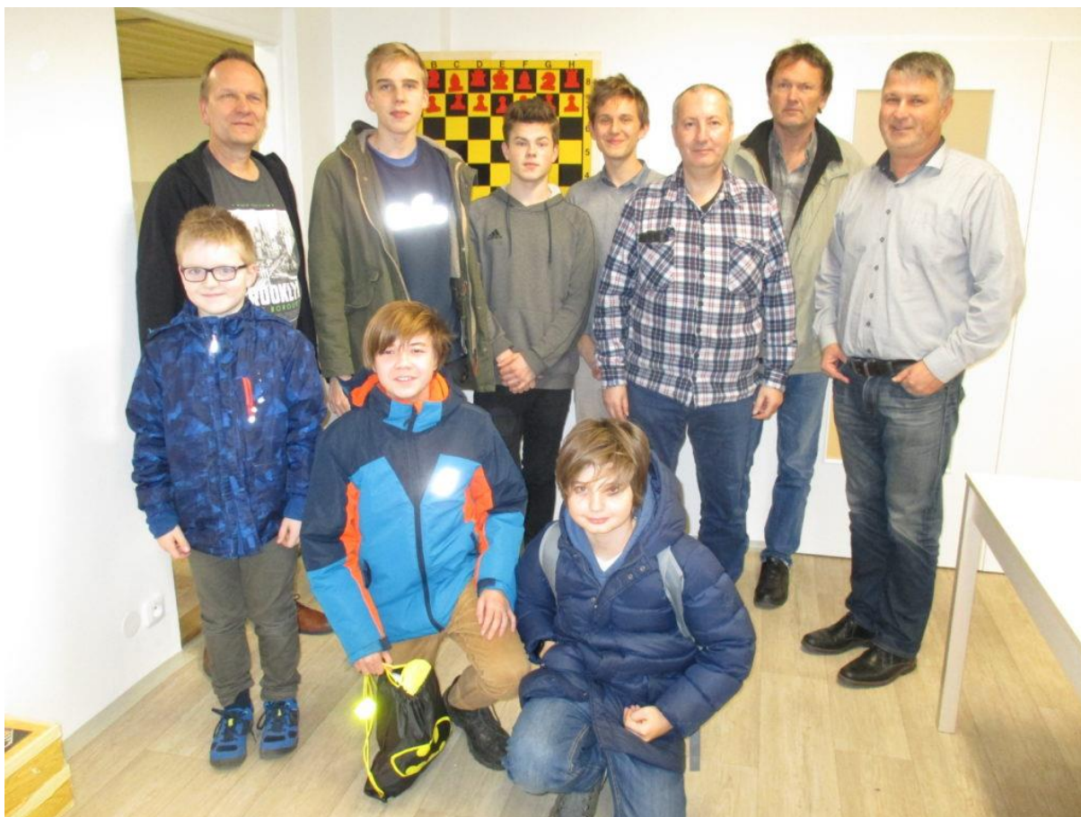
503 trenéři a pelhřimovští