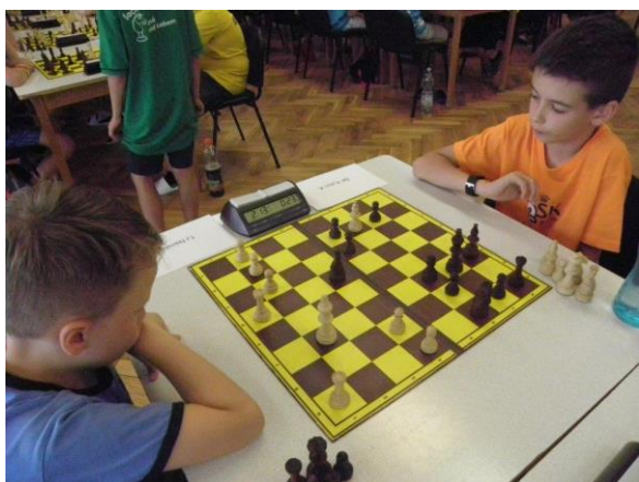
480 Max využil veškerý čas na přemýšlení