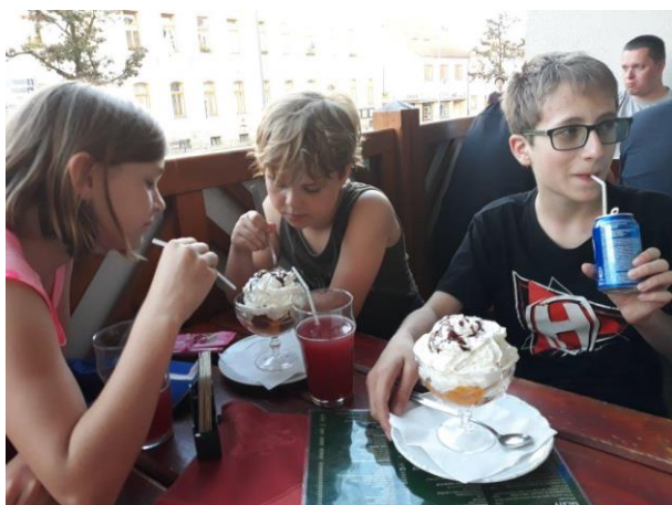
480 V páteční večer jsme se prošli na náměstí a dali jsme si něco dobrého...