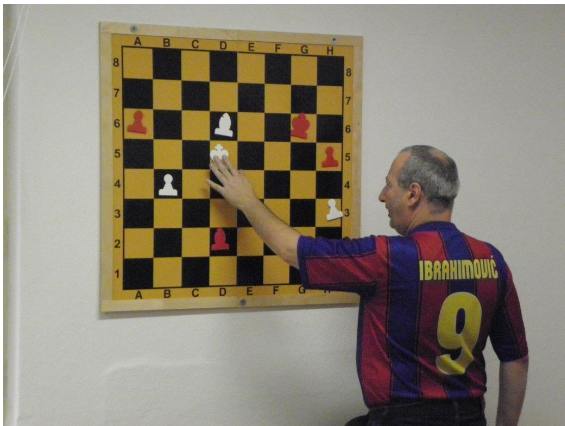
488 Střelcovka s komentářem velmistra