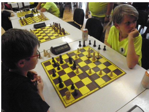
480 Matějova divoká partie

Ve 2. kole jsme dostali až 26. nasazený tým z Karlových Varů. V tomto zápase jsme beze zbytku potvrdili roli favorita a po rychlých výhrách Maxe, Lucky, Markéty a Kuby jsme brzy vedli 4:0. Matěj připravoval okolostojícím zajímavé zážitky a vedoucím Náměště vrásky na čele. Ve střední hře mohl vyhrát rychle po jednoduchém dxe2++ matem po následné oběti dámy, zvolil ale jiné braní a v dalším průběhu dal soupeři šance, které zůstaly nevyužity. V divoké partii nakonec rozhodla Matějova buldočí vůle dát mat. Tadeáš končil jako poslední. Ve střední hře s dámou proti 2 věžím ještě nebylo jasno, ale soupeř si sám nechal chytit jezdce a překročení času jen zkrátilo jeho beznadějný boj. Vyhráváme 6:0.