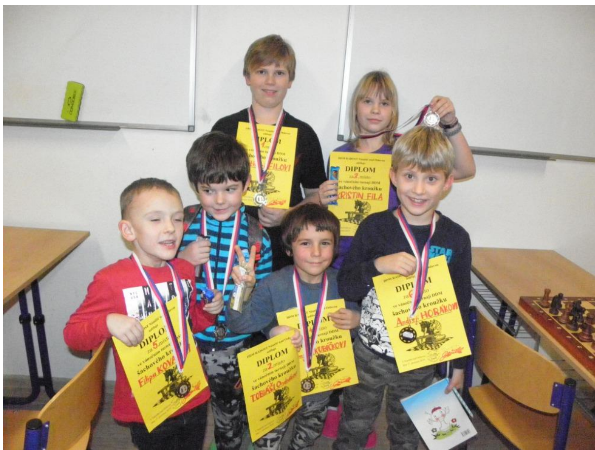
501 kroužek začátečníků

Včera jsme měli poslední šachové kroužky v roce 2019. V kroužcích začátečníků a mírně pokročilých jsme hráli turnaje o medaile. Věřím, že jste si dobře zahráli. Připomínám, že v sobotu 11. ledna se hraje v Náměšti turnaj Ligy Vysočiny o perníkovou chaloupku, kterého se určitě zúčastníte v maximálním počtu! Pro účastníky kroužku začátečníků to bude první turnaj, takže neočekávejte zatím nějaké body, protože budete hrát s mnohem zkušenějšími dětmi nejen z kraje Vysočina. Důležitější bude si hezky zahrát a snažit se napřed přemýšlet a teprve poté se dotýkat nějaké figury, s kterou pak potáhneme.