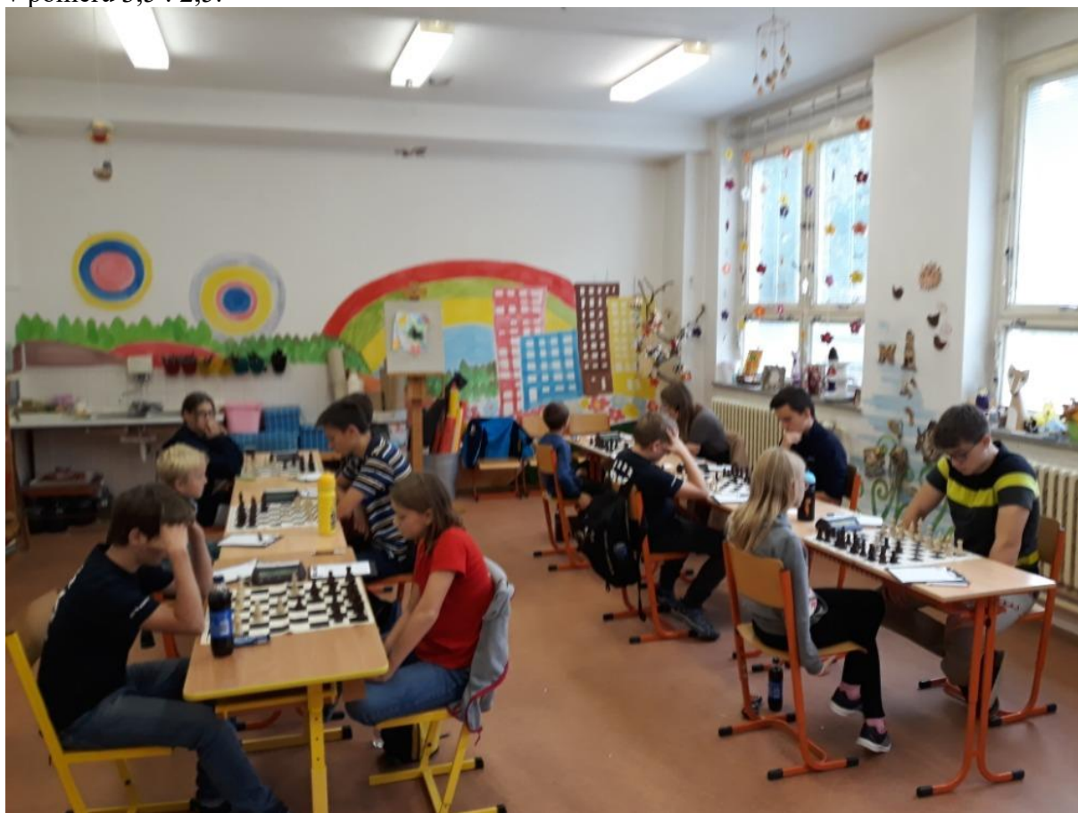
487 V prvním kole porážka od pardubických Polabin