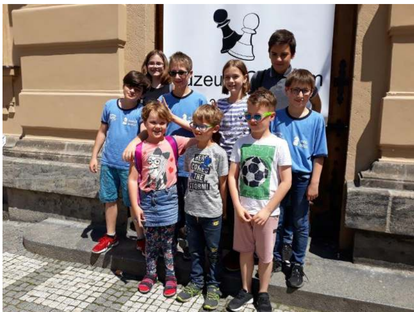
479 Náměšť v Chrudimi

Turnaj, který začal před lety jako oslava Mezinárodního dne dětí, se stal jedním z turnajů s nejdelsí tradicí, a to i v rámci všech sportů. Již 57. ročník „Zaječic“ se hrál o prvním červnovém víkendu v Chrudimi. Hlavní turnaj – MČR 6členných družstev starších žáků do 15 let hrálo celkem 72 družstev včetně čtyř z Vysočiny. V doprovodném turnaji dvojic nejmladších žáků do 9 let hrály mezi 63 dvojicemi tři z Vysočiny.