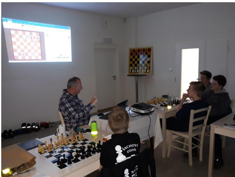
503 skupina A

Členové šachového oddílu TJ Spartak Pelhřimov, z.s. dostali za svoji sportovní činnost a dosažené výsledky od svého oddílu netradiční vánoční dárek – soustředění s trenéry 2. třídy. Soustředění se konalo dne 21. 12. 2019 v krásných nově zrekonstruovaných prostorách VOŠ a Střední školy hotelové Pelhřimov a bylo rozděleno do dvou skupin.