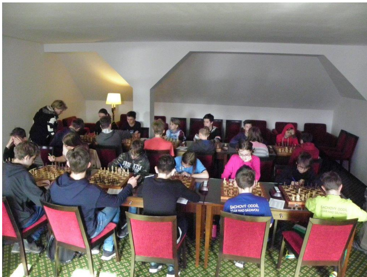
477 hrací místnost po zahájení 1.kola

Dům dětí a mládeže RADOST v Náměšti nad Oslavou ve spolupráci s firmou ALFIN-TRADING s.r.o. uspořádali 18. 5. 2019 Krajský přebor družstev mládeže. Přihlásila se 4 družstva, hrálo se kruhovým systémem 3 kola vážných partií se zápisem tempem 2x40 minut + 30 s/tah. Ředitel turnaje Jan Zezula zajistil nejen pěkné hrací prostory v prostorách firmy Oslavan, ale také obědy v restauraci Na statku.