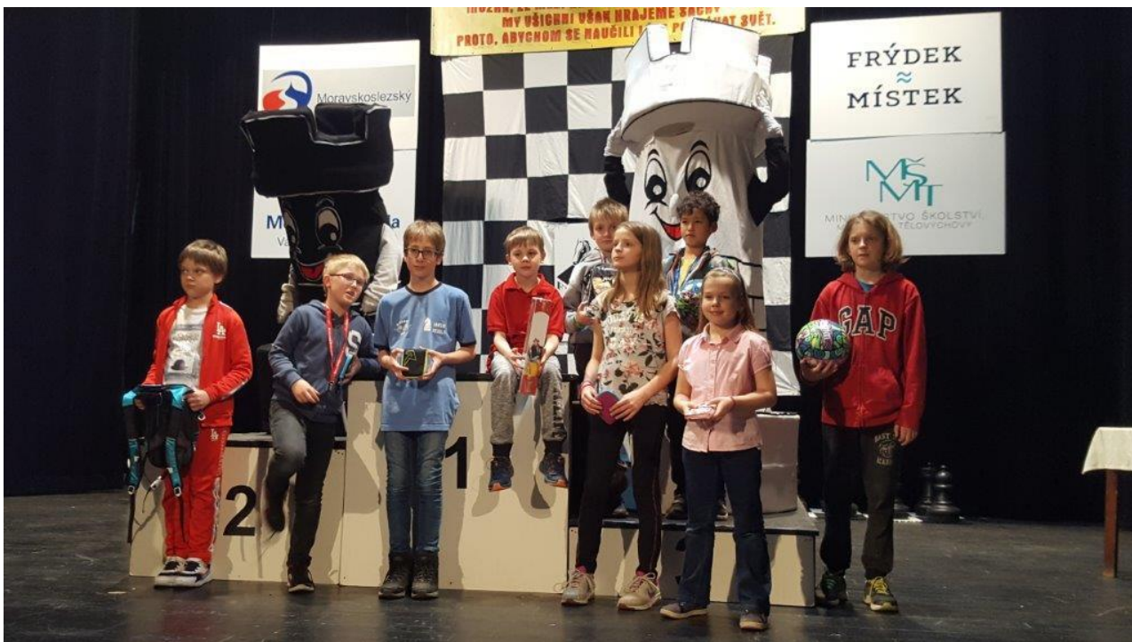
473 jako vždy úchvatné kulisy na TŠN