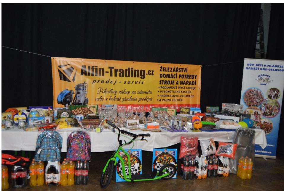
458 velmi bohaté ceny sponzoroval hlavně Alfin-Trading