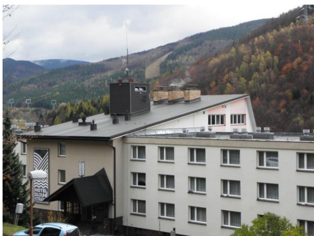
hotel Dlouhé stráně v Koutech nad Desnou

(8 členů z výpravy TJ Náměšť nad Oslavou)