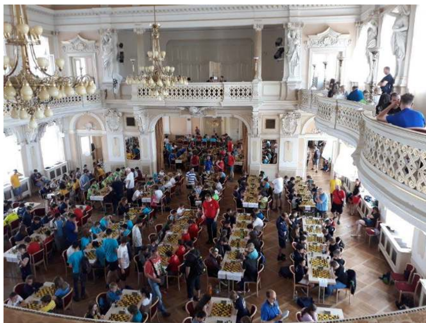
479 hlavní hrací sál