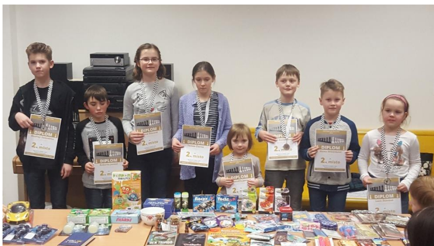
460 druzí v kategoriích Helena, Max a Lucie