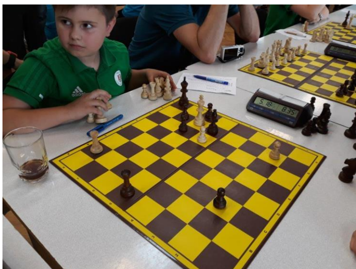
480 Matěj v prohrané pozici napochodoval králem na g6...