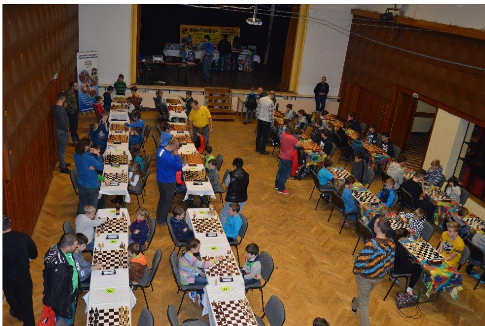
458 hrací sál v sokolovně

Zdravím všechny šachové příznivce, v první řadě děkuji všem za účast na dnešním turnaji. Počasí nám úplně nepřálo a mám velkou radost z toho, že se sešla skoro stovka účastníků. V příloze si dovoluji zaslat celkové výsledky dnešního turnaje (podrobné informace najdete na chess-results.com ) a také pár fotografií.