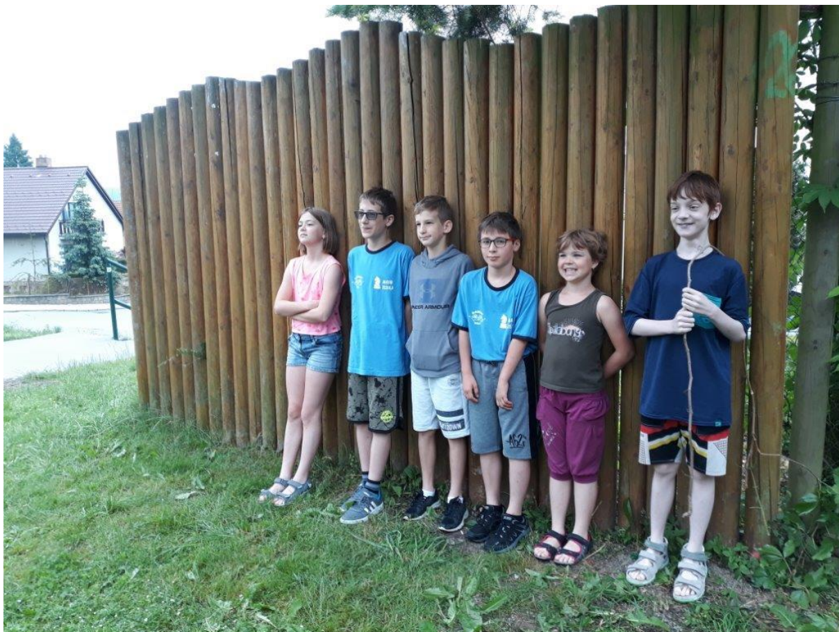
480 výborně naladěné družstvo před zápasem s ČB

Když jsem se ráno zeptal u palisády členů družstva, jak se vyspali a jak jsou bojovně naladěni, měl jsem radost, že jsou dobře nabuzení. Jakýkoliv úspěch byl fakticky nereálný.