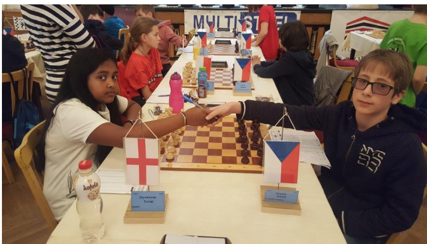
473 ... i Kuba, který s nasazovacím číslem 42 skončil po vynikajícím výkonu čtrnáctý v U12!