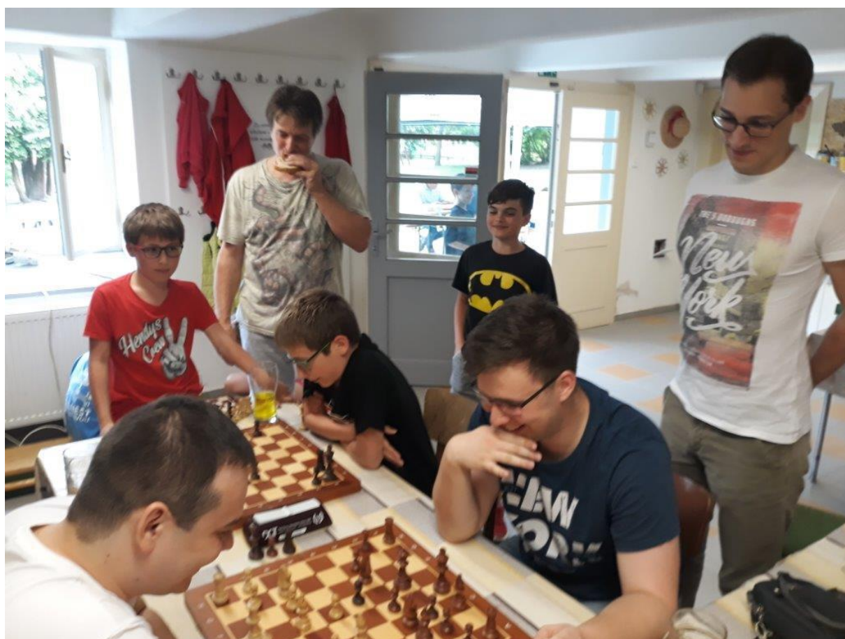
481 rozlučka a mladíci z Áčka

...posílám fotky z rozlučky. Sešlo se nás skoro 40. Přestože se letos nehrál během rozlučky žádný oficiální turnaj, myslím, že to nevadilo. Kdo chtěl, tak si zahrál, a to i napříč generacemi. Kdo chtěl, tak řešil soutěž. Popovídali jsme si, budeme se snažit naši klubovou činnost oživit. Díky i za přinesení dobrot udělaných doma. Dobře to vypadá i na fotce, a chutnalo ještě líp.