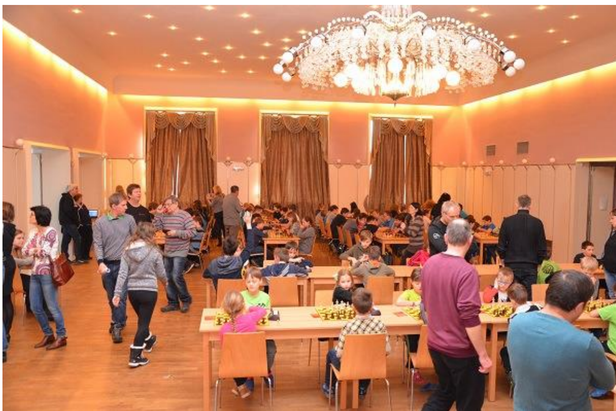
465 pohled do hracího sálu