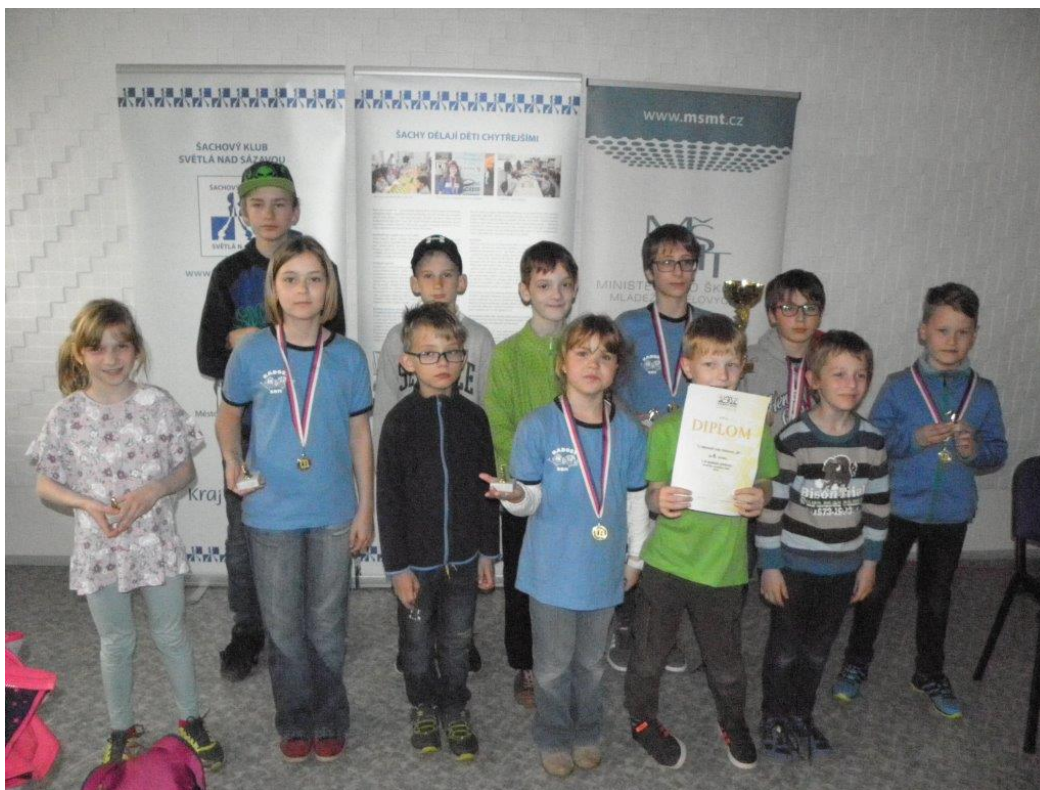
475 Áčko s Běčkem dohromady

V první květnovou sobotu se ve Světlé nad Sázavou hrál Krajský přebor družstev mladších žáků. Podobně jako naši soupeři jsme využili možnost zařadit do družstva jednoho hosta. I díky tomu jsme byli schopni jako jediní postavit družstva A a B. Áčko se mělo pokusit vyhrát a Běčko si hlavně zahrát a nasbírat zkušenosti.