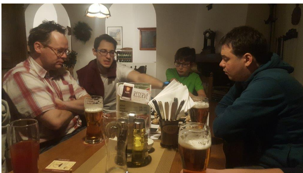
473 čekání na oběd se dá využít...