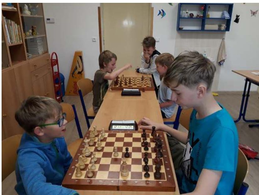
478 kroužek začátečníků