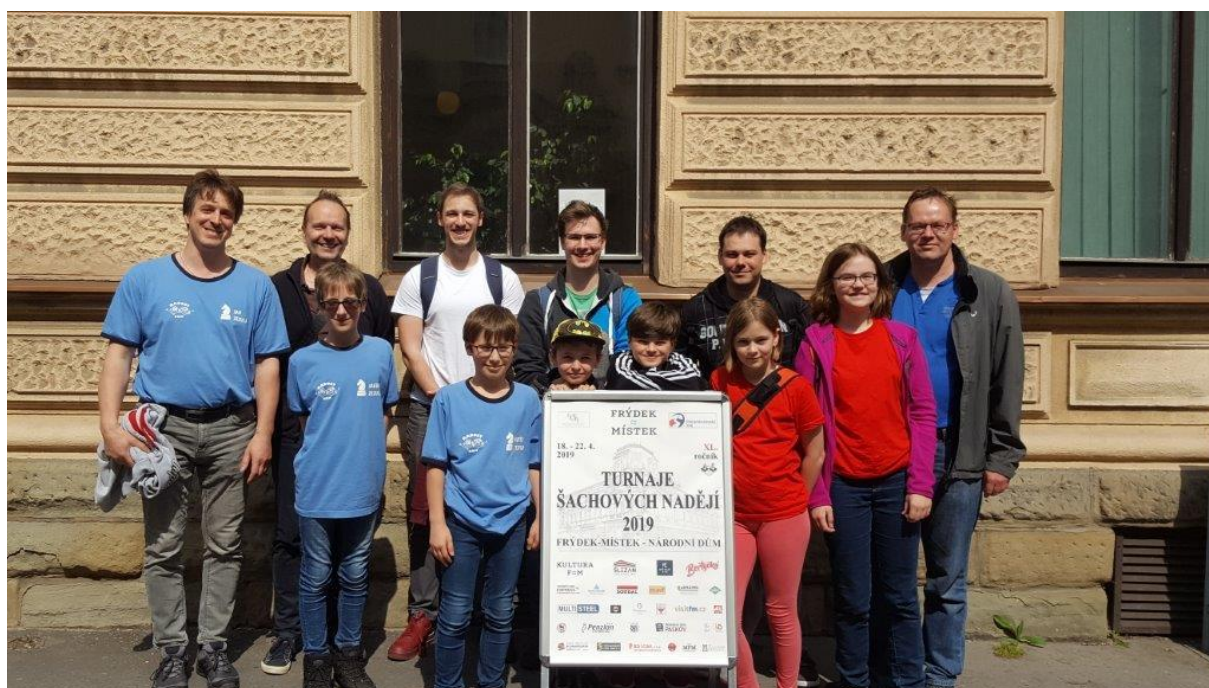
473 náměšťská výprava před Národním domem ve Frýdku-Místku

Již tradičně je 5 jarních dní končících Velikonočním ponděním v Národním domě ve Frýdku-Místku plno.